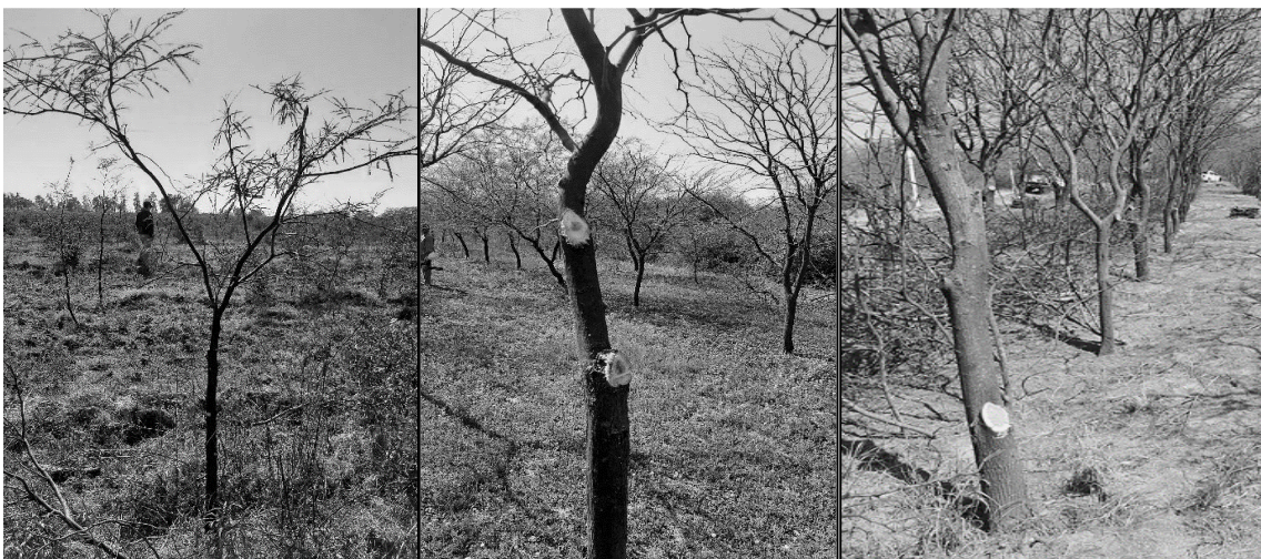
Figura 5. Actividades de poda en plantaciones de diferentes edades biológicas. De izquierda a derecha 1ª, 2ª y 3ª poda.

Los valores de diámetros de ramas podadas en los tres tipos de podas (Figura 4) oscilaron entre 0,5 cm a 10 cm. Se observó que la tijera de podar se desempeña bien hasta diámetros de ramas de 3 cm, el serrucho de podar entre un rango de 3-5 cm y diámetros mayores a 5 cm requieren de motosierra para optimizar el trabajo.