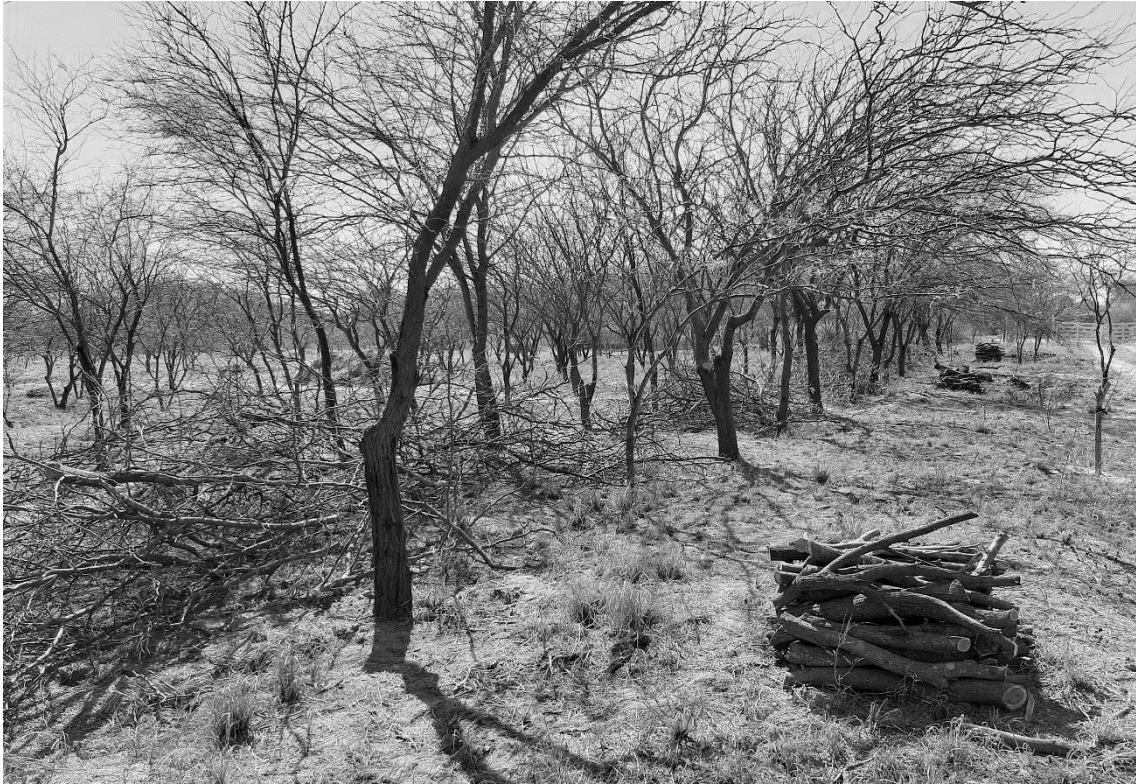
Figura 3. Apilado de leña y acordonado de residuos de 3ª poda de conducción.

Los valores de diámetros de ramas podadas en los tres tipos de podas (Figura 4) oscilaron entre 0,5 cm a 10 cm. Se observó que la tijera de podar se desempeña bien hasta diámetros de ramas de 3 cm, el serrucho de podar entre un rango de 3-5 cm y diámetros mayores a 5 cm requieren de motosierra para optimizar el trabajo.