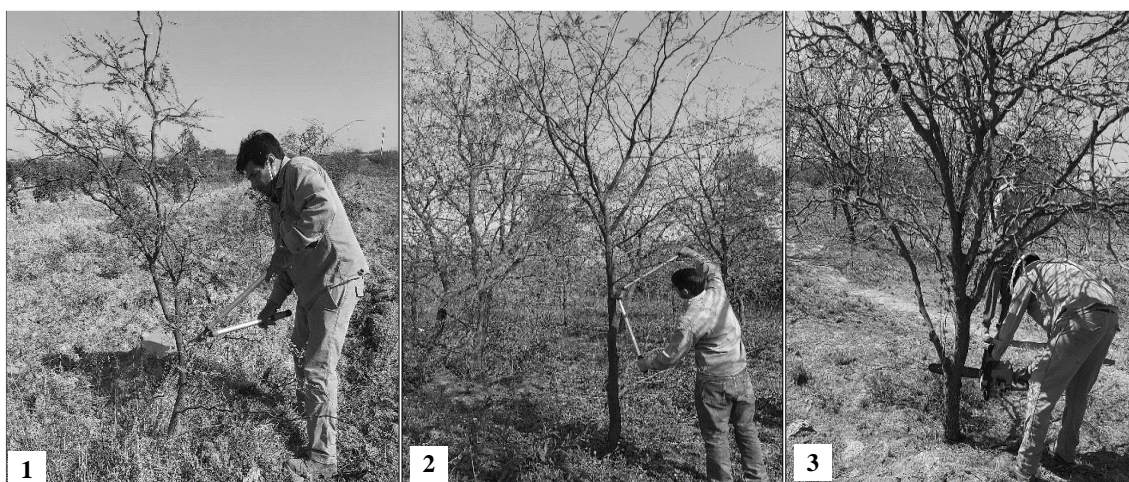
Figura 2. Primera poda de formación (1); segunda y tercera poda de conducción (2-3).