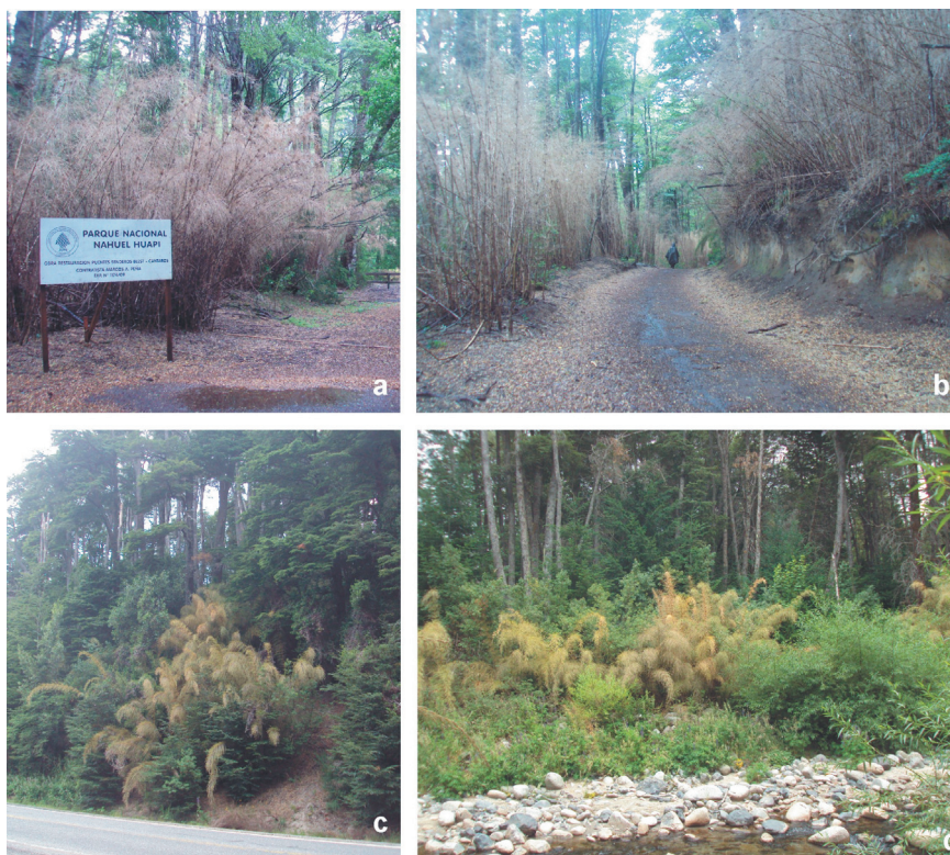
Figura 3. Floración de Chusquea argentina . a y b) Floración masiva en Puerto Blest, Parque Nacional Nahuel Huapi, Río Negro, enero de 2012. c y d) Floración de ejemplares aislados en Villa La Angostura, Neuquén, enero de 2019.