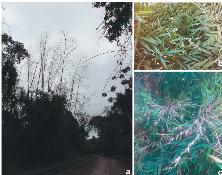
Figura 1. a) Ejemplares senescentes de Guadua chacoensis luego de la floración, Parque Nacional Iguazú, Misiones, julio de 2010. b y c) Ejemplares de Guadua trinii en floración, Parque Nacional Iguazú, Misiones, noviembre de 2021.

En la Región Antártica, los bambúes leñosos habitan en el Dominio Subantártico, exclusivamente en la Provincia Subantártica, en tres distritos: el Distrito del Pehuén, el Distrito del Bosque Caducifolio y el Distrito Valdiviano (Cabrera 1976). El Distrito del