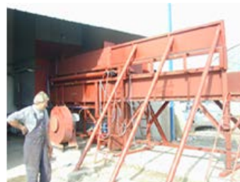
Slika 4. Hidraulični dozator bala