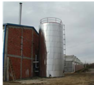
Slika 2. Kotlarnica sa akumulatorom toplote od 100 m3

Na slikama 2, 3, 4 i 5 prikazano je izgrađeno postrojenje