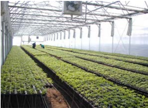
Slika 6. 1 ha grejanih plastenika

što primena biomasa u formi bala ne iziskuje nikakav naknadni tretman (rasturanje bala, seckanje biomase, međutransport i skladištenje) a samim tim donosi i veliku uštedu energije i smanjenje investicionih i eksploatacionih troškova.