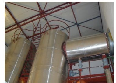
Slika 3. Razmenjivač toplote (pozicije 13,14,15 sa slike 1)