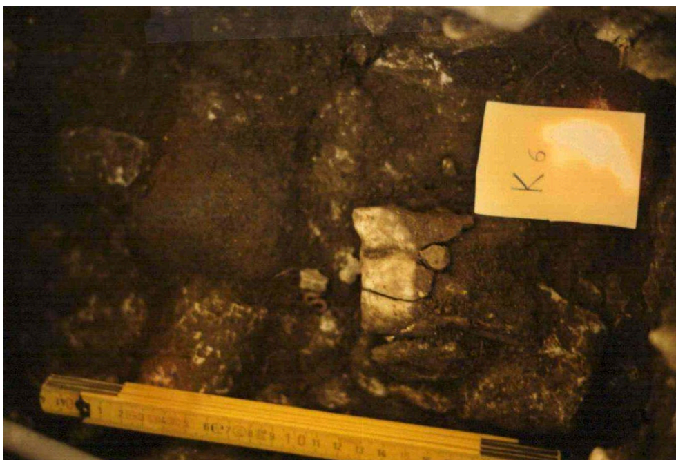
Carré K6, couche F.