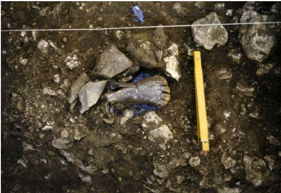
Fig. 3 – Fragment de mandibule de cheval