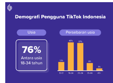
Gambar 1 Data pengguna TikTok di Indonesia

aplikasi yang digandrungi masyarakat khususnya kalangan remaja di Indonesia. Berikut merupakan data pengguna TikTok di Indonesia berdasarkan usia.