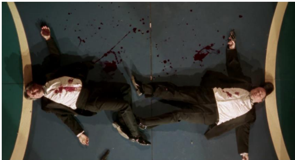
Imagen 3. Fotograma de Muertos de risa

En esta película se inicia una tendencia frecuente en el cine de Álex de la Iglesia consistente en mostrar imágenes macabras frente al público y que este las considere ficción. En un intento por mostrar lo narcotizada que está la sociedad, el director lleva al extremo el esperpento con auténticos crímenes tomados como parte del simulacro mediático. Las risas grotescas, la muerte televisada y las angulaciones aberrantes refuerzan desde el proflmico esta realidad. En este caso, Bruno (Santiago Segura) y Nino (el Gran Wyoming) se disparan el uno al otro ante centenares de personas, quienes no cesan de reír al tomarlo como parte del espectáculo.