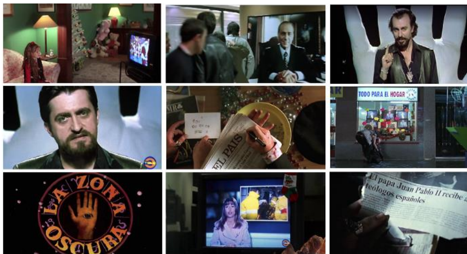
Imagen 1. Fotogramas de El día de la bestia