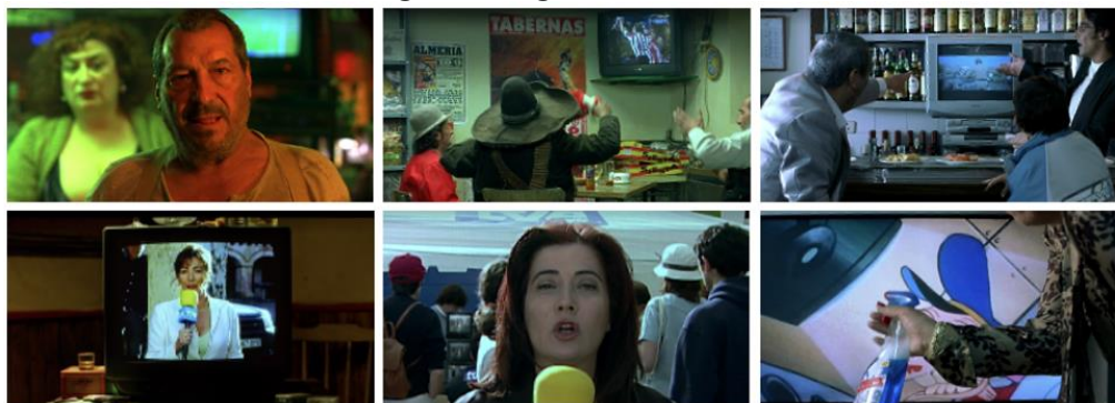
Imagen 7. Fotogramas de 800 balas