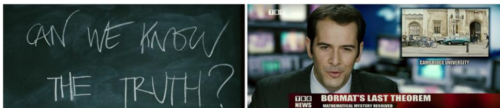
Imagen 2. Fotogramas de Los crímenes de Oxford

La verdad también se persigue con denuedo en Los crímenes de Oxford (2008), película que comienza con una clase magistral de Arthur Sheldon (John Hurt), quien hace una única pregunta: ¿podemos conocer la verdad?, arguyendo más tarde “todos los grandes pensadores de la historia han buscado una sola certeza, algo que nadie pudiera negar, como dos y dos son cuatro”. De la Iglesia prosigue en su énfasis sobre la verdad: “No existe ninguna verdad fuera del mundo de las matemáticas, no hay forma de encontrar ni una sola certeza absoluta, ningún argumento irrefutable que nos ayude a dar respuesta a las preguntas de la humanidad”. Tal como sucedía en El día de la bestia , en esta ocasión el director insiste en su particular opinión respecto a los medios: “Todo lo que dicen los periódicos es mentira, ¿no lo sabía?”. El propio protagonista (Elijah Wood) admite abatido: “la verdad no es matemática, como yo pensaba, es absurda, confusa, casual, desordenada y muy desagradable”.