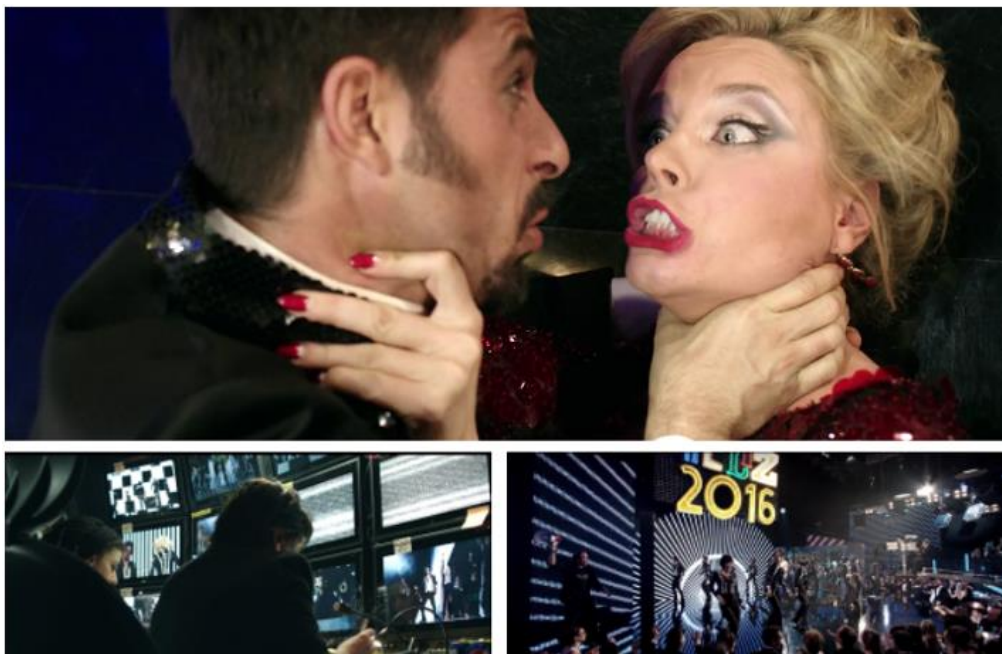
Imagen 10. Fotogramas de Mi gran noche