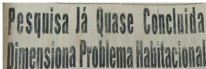
Figura 3 – Título de matéria publicada no Jornal do Dia , São Luís (1968).