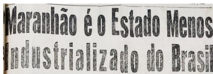
Figura 1 – Título de matéria publicada no Jornal do Dia , em maio de 1966