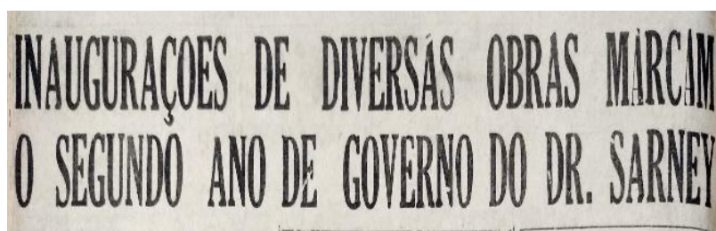
Figura 4 – Título de matéria publicada no jornal O Imparcial , de São Luis (1968), noticiando as obras realizadas no segundo ano do Governo Sarney