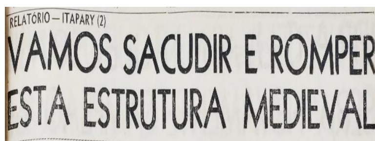
Figura 1 – Título de relatório publicado no Jornal do Dia, São Luis, em março de 1966