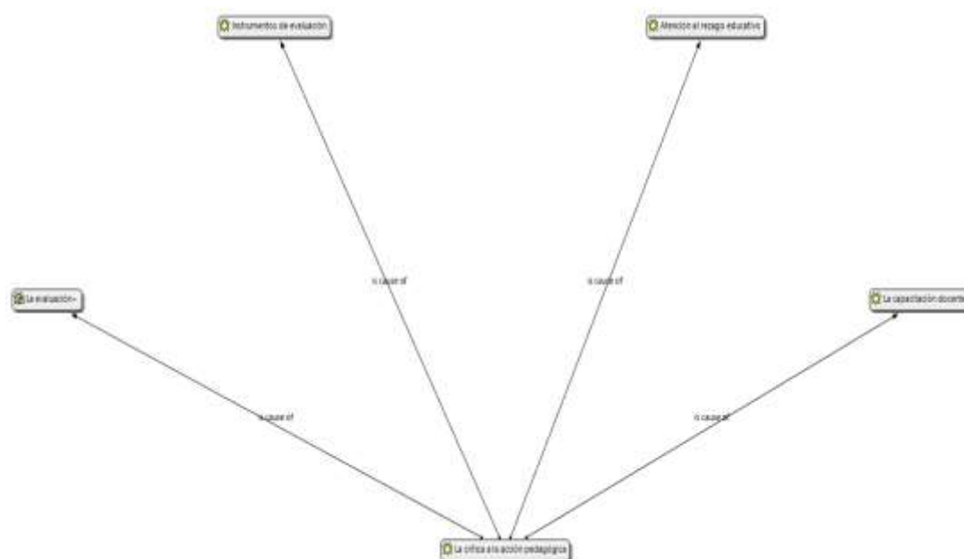
Figura 3: La crítica a la acción pedagógica

La tercera categoría: La crítica a la acción pedagógica se refiere a la evaluación de los aprendizajes, pero también, de la misma práctica pedagógica del profesorado. En esta categoría, se presenta, analiza e interpreta la percepción del docente sobre qué es, qué función cumple y cómo realiza la evaluación del proceso de enseñanza aprendizaje. En la Figura 3 se pueden apreciar las subcategorías: