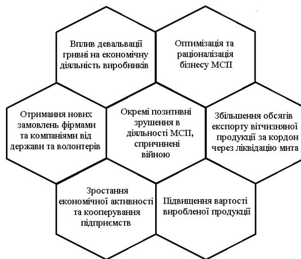
Рис. 2. Окремі позитивні зрушення у діяльності МСП спричинені війною в Україні

підприємств (МСП), приводячи до несприятливих наслідків, а в інших випадках інколи — до позитивних зрушень у їхній діяльності. Вплив війни переважно мав руйнівний характер для МСП, проте криза в певних випадках виявилася можливістю для розвитку та адаптації: Основні позитивні зрушення в діяльності МСП показані на рисунок 2 .