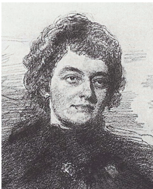
Рис. 2. И.Е. Репин. Рисованное изображение З. Гиппиус