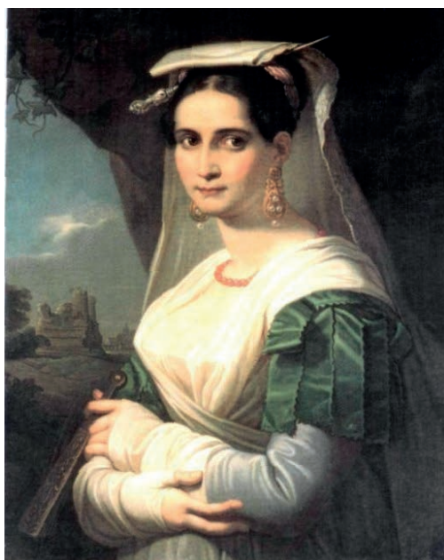
Рис. 9. «Портрет неизвестной» Fig. 9. "Portrait of an unknown woman"

нее неидентифицированным портретом известной личности. Поскольку происхождение и авторство подобных портретов не всегда очевидны, их исследование может вызвать у искусствоведов определенные сложности. Так, спорная ситуация возникла при исследовании живописного изображения молодой женщины в итальянском костюме. Портрет поступил из государственного фонда как «Портрет неизвестной» (рис. 9). В Государственном музее А.С. Пушкина предположили, что это портрет А.О. Смирновой-Россет 4 .