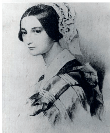
Рис. 10. Атрибутированные портреты А.О. Смирновой-Россет Fig. 10. Attributed portraits of A.O. Smirnova-Rosset