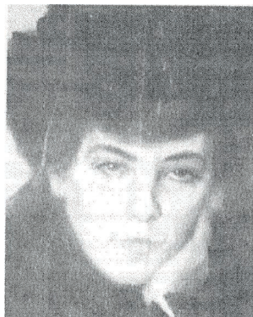
Рис. 1. В.А. Серов. Идеализированный образ З. Гиппиус

Нередки случаи, когда портреты одного человека несколько разнятся в зависимости от стиля художников, которые над ними работали. Так, В.А. Серов и И.Е. Репин в один и тот же период занялись написанием портрета З. Гиппиус 1 . В результате у В.А. Серова, имевшего целью создать идеализированный образ поэтессы (рис. 1), и у И.Е. Репина, мастера реалистичной живописи (рис. 2), получились разные изображения З. Гиппиус.