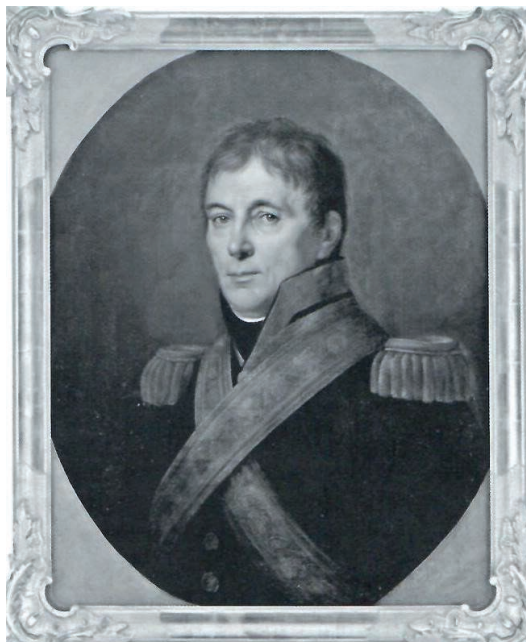
Рис. 3. Предполагаемый портрет А.А. Аракчеева

появление портрета, на котором, вероятно, был изображен А.А. Аракчеев 2 , одетый в непривычный для его статуса мундир (рис. 3), потребовало проведения портретного экспертного исследования [11].