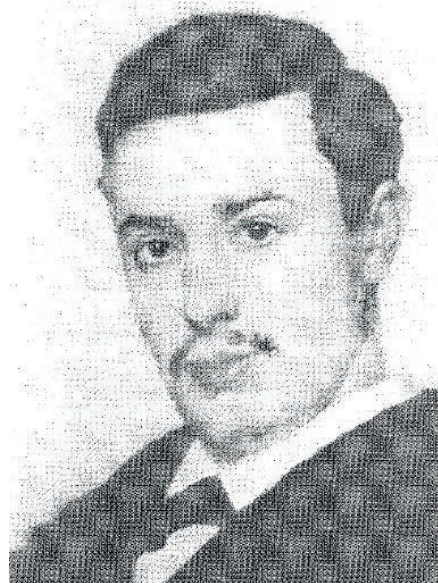
Рис. 6. И.Е. Репин. Портрет молодого человека Fig. 6. I.E. Repin. Portrait of a young man

Вышеупомянутый портрет на тот момент не был атрибутирован и считался портретом неизвестного (рис. 6). Поэтому для сравнительного анализа требовались другие изображения С.П. Дягилева, отвечающие критерию достоверности в передаче его внешнего облика. Особую сложность при исследовании создавало отсутствие изображений, запечатлевших Дягилева в достаточно молодом возрасте.