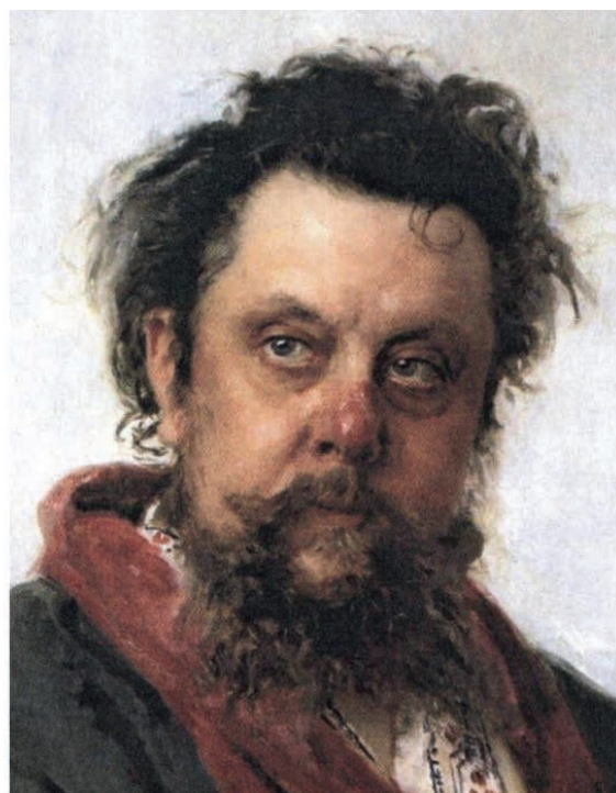
Рис. 5. М.П. Мусоргский: предполагаемый портрет (слева), портрет работы И.Е. Репина (справа) Fig. 5. M.P. Mussorgsky: the alleged portrait (left), portrait by I.E. Repin (right)