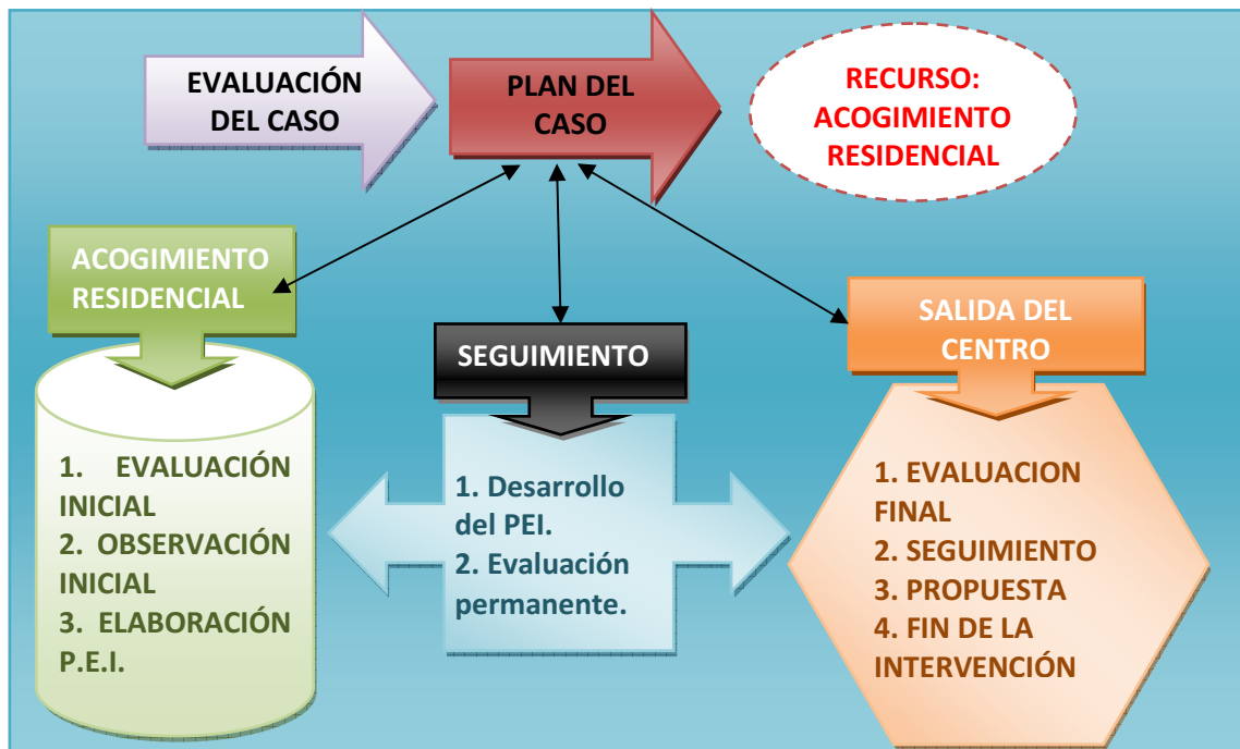
Figura 1.- Proceso de intervención en desprotección infantil.

Ante el conocimiento de una posible situación de desprotección infantil, se inicia el proceso de intervención y valoración que concluirá con la inclusión del menor en un programa de intervención adecuado.