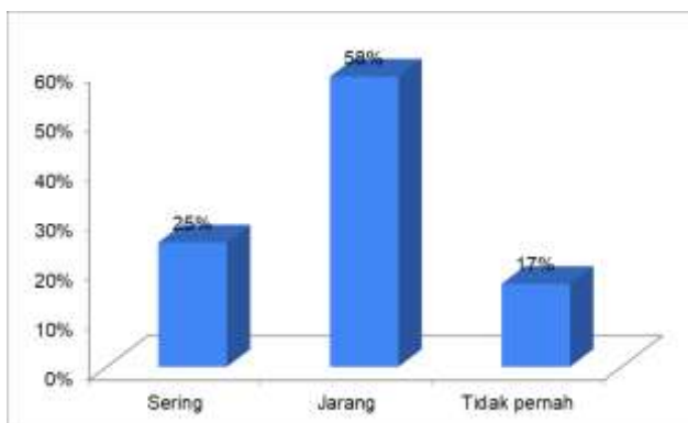
Gambar 1. Intensitas penggunaan media online

Berdasarkan gambar 1 dapat dijelaskan bahwa jumlah guru yang sering menggunakan media online dalam pembelajaran hanya 25%, sedangkan 58% mengaku jarang dan 17% diantaranya mengaku tidak pernah menggunakan media online dalam pembelajaran.