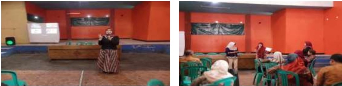
Gambar 3: Sesi Pengenalan Teknik Digital Storytelling