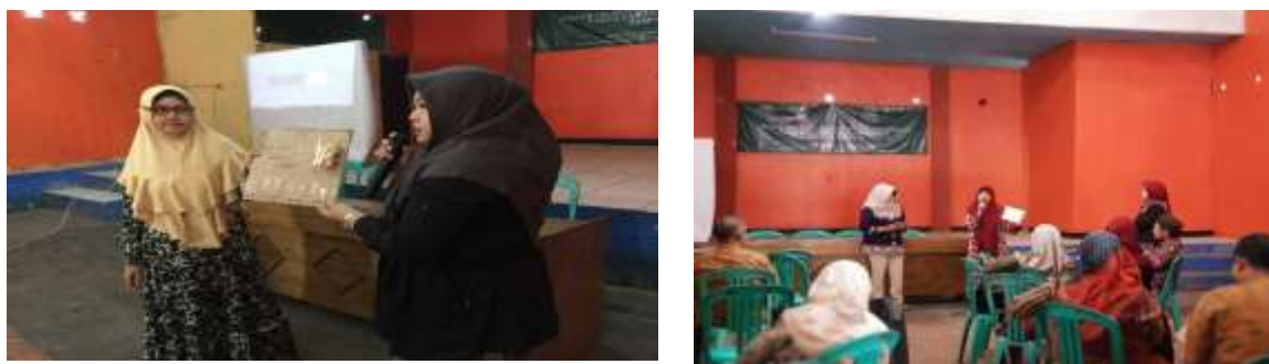
Gambar 4: Sesi Presentasi Digital Storytelling