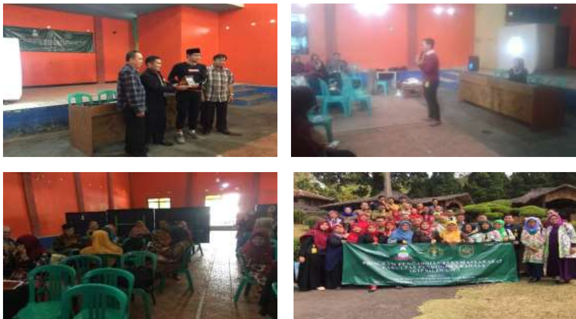
Gambar 2: Sesi Pengenalan Karakteristik Anak Usia Dini