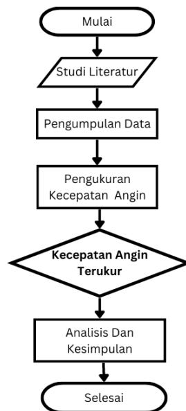
Gambar 1. Flowchart Langkah Penelitian

Penelitian ini dilakukan di Area Persawahan Desa Bader, Kecamatan Dolopo, Kabupaten Madiun, Jawa Timur. Teknik yang digunakan pada penelitian ini adalah melakukan studi literatur dan observasi dengan pengamatan secara langsung di Area Persawahan Desa Bader dengan mengumpulkan data yang diperlukan untuk mengetahui potensi angin sebagai pertimbangan pembangunan pembangkit listrik tenaga bayu (PLTB). Pengukuran dengan alat yang menggunakan Anemometer untuk mengetahui hasil kecepatan angin.