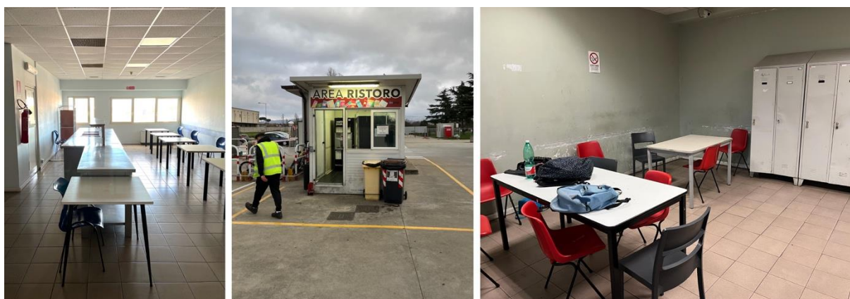
Figura 2 | Ce.Di. per il cibo fresco a Santa Palomba, spazi accessori per i lavoratori.

Molti degli spazi che assolvono queste attività paiono in realtà scarti dello spazio logistico, siano essi spogliatoi, salette ristoro, uffici, o sala mensa. Collocati in un'appendice della struttura principale, sono caratterizzati da una scarsa qualità architettonica, piccole dimensioni e minime dotazioni di confort. Tanto che durante la pandemia, quando le norme di distanziamento interpersonale hanno portato alla necessità di aggiungere ulteriori spazi, come punti ristoro e spogliatoi, si è ricorso a container posizionati al centro del parcheggio destinato al personale. In questi spazi è spesso evidente la stratificazione di usi (i muri degli uffici sono ricoperti di vecchie campagne aziendali, le scrivanie ospitano foto di famiglia, peluche, gadget vari), ed è talvolta forte l'interazione (come quando a fine turno vi si segue tutti assieme una partita di calcio sullo schermo di uno smartphone).