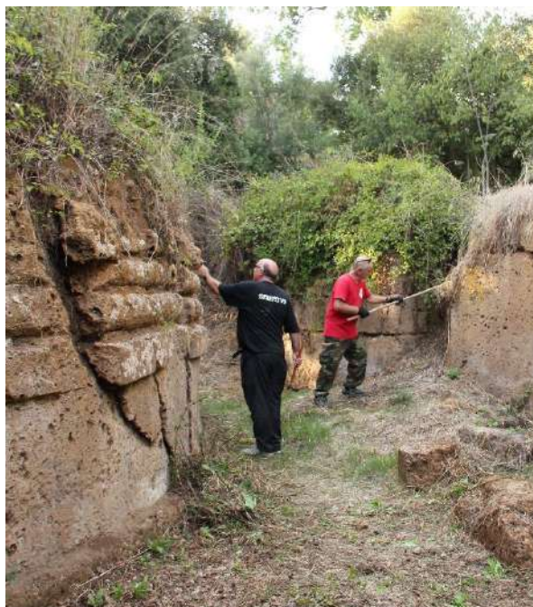
Fig. 4 Volontari all'opera tra gli edifici funerari di una delle aree esterne della necropoli.