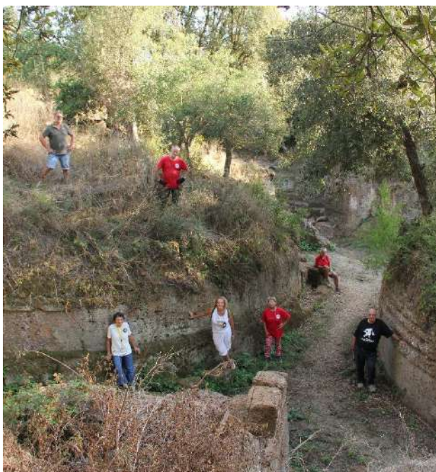
Fig. 3 Alcuni volontari del Gruppo Archeologico Romano, Sezione Cerveteri-Ladispoli-Tarquinia.