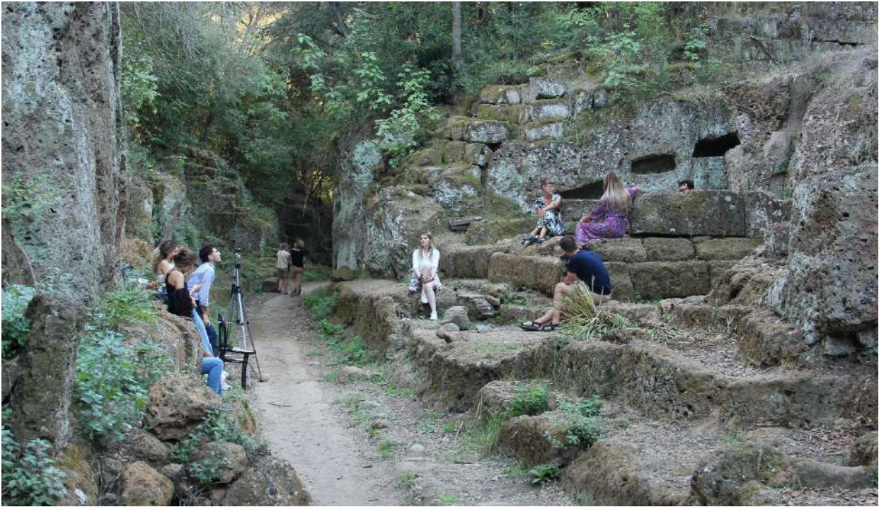
Fig. 2 La necropoli come luogo di incontro. Nella foto gli artisti del collettivo Ladispolaneamente in un momento di discussione tra i ruderi della cosiddetta Via degli Inferi, una delle aree libere della necropoli.