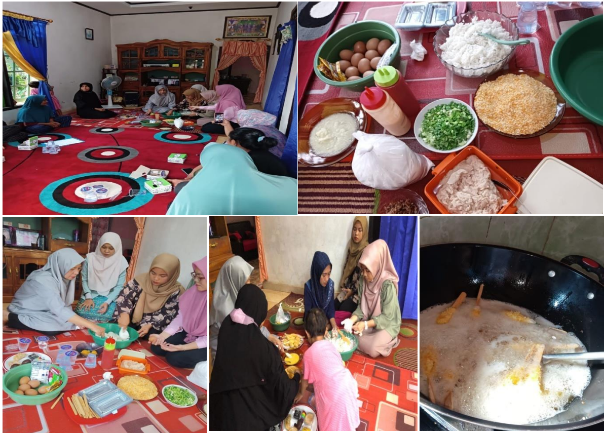
Gambar 2. Dokumentasi Kegiatan Pengolahan Nuget Sempol