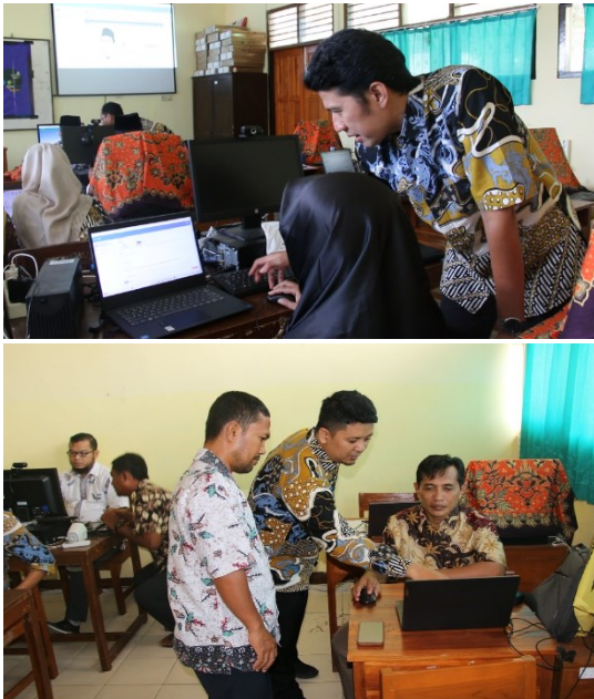
Gambar 4. Pendampingan dan Diskusi dalam Merancang Media Pembelajaran Video dan Buku Interaktif