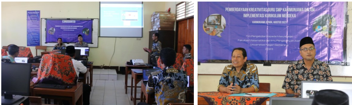
Gambar 1. Pembukaan Kegiatan Pengabdian kepada Masyarakat

Kegiatan pengabdian kepada masyarakat ini terdiri dari dua sesi. Sesi pertama, yang merupakan inti dari kegiatan ini, diadakan pada tanggal 4 Agustus 2023, Jumat. Sedangkan sesi kedua, yang merupakan kelanjutan dari kegiatan, dilaksanakan hingga tanggal 11 Agustus 2023, Jumat secara daring.