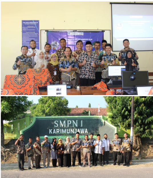
Gambar 5. Kegiatan Pengabdian kepada Masyarakat di SMPN 1 Karimunjawa Sukses Dilaksanakan