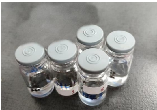
Gambar 1. Sampel individu lebah tanpa sengat.

Pelaksanaan pengambilan sampel individu lebah tanpa sengat di Desa Harapan Jaya, Kecamatan Way Ratai, Kabupaten Pesawaran, Provinsi Lampung berhasil mendapatkan sampel dari 5 (lima) koloni yang berbeda. Sampel lebah tanpa sengat diambil 2 sampai dengan 3 individu dari masing-masing koloni dan dimasukkan ke dalam botol vial serta ditambahkan larutan PBS (Gambar 1).