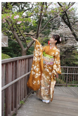
Fot. 7. Przykład furisode , 2015. A Japanese lady wearing a Furisode (a type of Kimono) appreciates the beauty of flowers