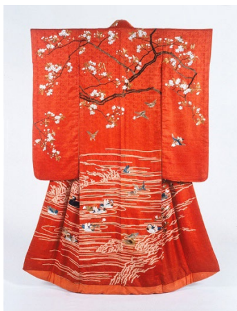
Fot. 8. Kimono typu uchikake , późny okres Edo (koniec XVIII do poł. XIX w.); jedwab; motyw kwitnących dzikich wiśni yamazakura i kaczek mandarynek wykonane haftem, motyw fal techniką farbiarską kanoko shibori 鹿の子絞り, „rozrzucone” na powierzchni znaki kanji nawiązują do zbioru poezji waka „Kokin-waka-shū”. Długość 177 cm, szer. 122 cm., długość rękawów 102,3 cm. Kolekcja Bunka Gakuen Costume Museum, wcześniej w kolekcji rodziny Mitsui