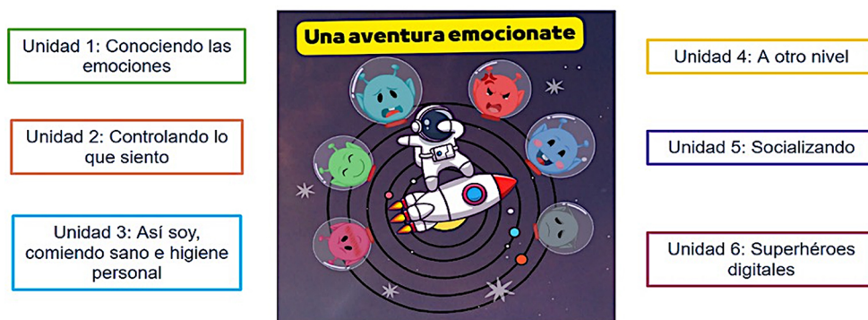
Figura 4. Unidades estrategia didáctica

través de una secuencia narrativa siendo la clave que permite el desarrollo de la gamificación, que conforma la lúdica de la educación virtual, teniendo como propósito que los estudiantes sean los protagonistas de la historia en la que, en cada capítulo, se encuentra en un nuevo lugar cumpliendo una misión que le permite reflexionar sobre la importancia de la habilidad que se esté desarrollando. Cada una tiene un tiempo estimado de una semana o puede depender del tiempo que le asigne el docente que la esté orientando, con el fin que los estudiantes puedan realizar todas las actividades propuestas, por lo que las unidades serán habilitadas a medida que estos vayan avanzando teniendo en cuenta su hilo conductor. Cada unidad tiene establecidas tres competencias enfocadas al ser, al saber y al hacer, que guían cada una de las actividades planteadas.