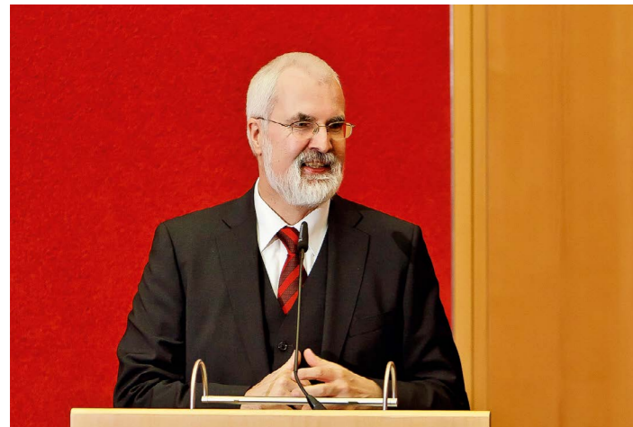
// Andreas Schurig // Fotos: R. Deutscher

Am 17. März 2017 beging die Behörde des Sächsischen Datenschutzbeauftragten ihr 25-jähriges Bestehen mit einem Festakt im »Ständehaus«, dem historischen Landtagsgebäude Sachsens.