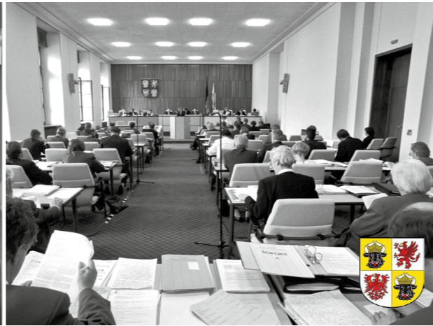
// Mecklenburg-Vorpommern – Landtagssitzung 1992 // Foto: picture-alliance/ZB/Jens Büttner