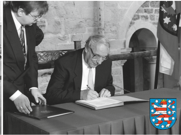
// Thüringen – Verabschiedung Verfassung 1993 auf der Wartburg in Eisenach // Foto: Landtag Thüringen