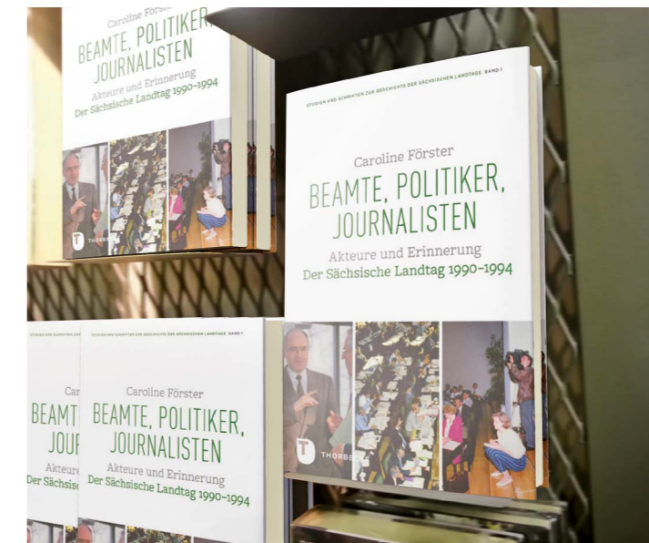
// Band 1 der Studien und Schriften zum Sächsischen Landtag wird am 25. April 2017 im Sächsischen Landtag vorgestellt.

Die öffentliche Buchpräsentation findet am 25. April 2017, um 15 Uhr im Bürgerfoyer des Sächsischen Landtags statt. Um Anmeldung wird bis spätestens 20. April 2017 gebeten unter: veranstaltungen@slt.sachsen.de