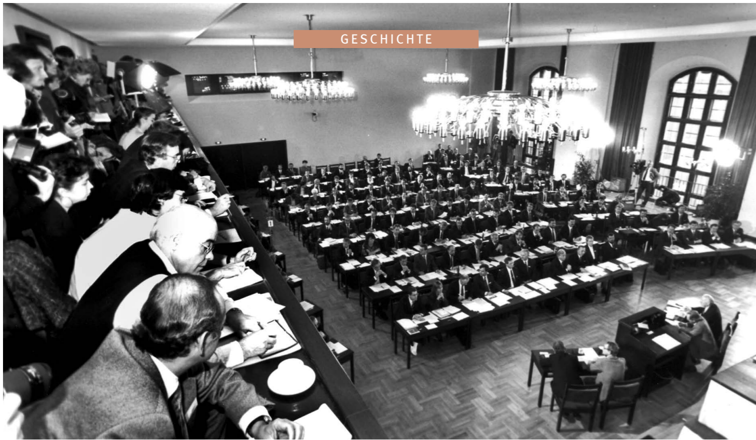
// Blick in den Tagungsraum des Sächsischen Landtags in der Dreikönigskirche // Foto: M. Hieckel