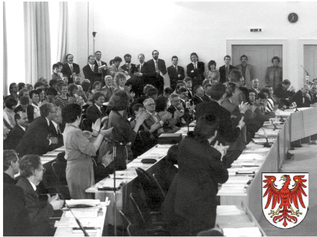
Brandenburg – Plenum nach Verabschiebung des Entwurfes 14.4.1992