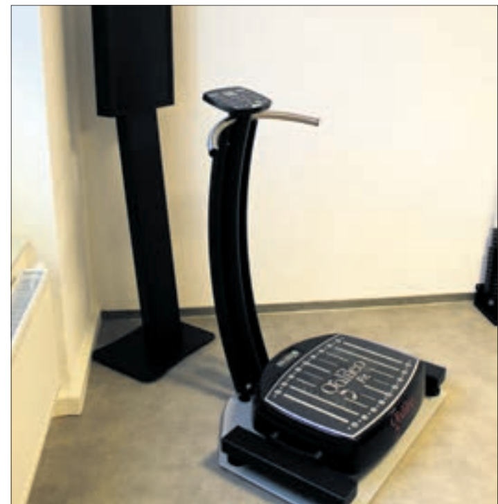
Moderne Stimulation für Muskeln und Gleichgewicht: Die Galileo Vibrationsplatte bei Physio & Vital Thalheim, bereit für zukunftsweisendes Vibrations-training.

Malerarbeiten aller Art · Moderne Innenraumgestaltung · Verlegen & liefern von Bodenbelägen · Betonbeschichtung · Ausführung von Wärmedämmverbundsystemen