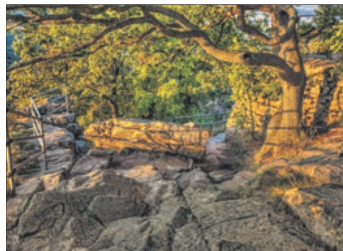
Ob über Berge oder durch Täler Feriencamps sind für Kinder immer aufregend.

Unvergessliche Momente für Groß und Klein sind garantiert. Dabei finden die WWF Junior Camps hauptsächlich in Deutschland statt. In „Besuch bei Bienen, Wisenten und Wildpferden“ im Teutoburger Wald zum Beispiel wohnen die Jüngeren im gemütlichen Tipi und streifen täglich unbeschwert durch Wälder, Wiesen und Bäche. Beim Inselabenteuer auf Spiekeroog erforschen sie Naturwunder zwischen Wattenmeer und Kutterfahrten. Für Jugendliche geht es auch in verschiedene europäische Länder: Unter anderem steht Schnorcheln in Kroatien auf dem Programm, wo es die faszinierende, aber auch gefährdete Unterwasserwelt zu entdecken gilt. Beim Paddeln in Schweden erfahren die Kids Wälder, Wasser und Weite inmitten einer spektakulären Wildnis. Neu sind 2024 zwei Jugendfreizeiten in Italien mit aufregendem Wildwasserrafting auf dem Tagliamento-Fluss sowie vier Familiencamps. Bei letzteren ziehen Kinder gemeinsam mit ihren Familien ins Naturerlebnis und erkunden beispielsweise Höhlen auf der Schwäbischen Alb oder gehen auf Tierspuren im Fläming. In allen Camps werden die Kinder und Jugendlichen von erfahrenen Pädagog:innen und Naturschützer:innen begleitet.