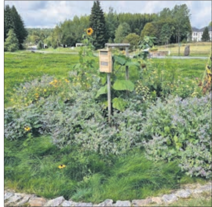
Karsten Röttschke: Umgestaltung der „Halde 42“ des früheren Uranerzbergbaus zum Landschaftspark: Erschaffung eines Baumerlebnis-Pfades, Anschaffung Wasserauffangbehälter und Regentonnen, Bau eines Geräteschuppens, Stadt Johanngeorgenstadt.

In diesem Jahr 2023 wurde im Rahmen des Ehrenamtsbudgets erstmals das Kommunale Bürgerbudget aufgenommen, dass zur Umsetzung lokaler Projekte aus niederschwelligem bürgerschaftlichen Beteiligungsverfahren dienen soll. Die im Haushaltsjahr 2023 durch den Freistaat Sachsen zur Verfügung gestellten Mittel betragen rund 38.500 Euro und wurden durch den Erzgebirgskreis auf insgesamt 40.000 Euro aufgestockt. Gemäß der vorliegenden Fachempfehlung vergab der Erzgebirgskreis in Abstimmung mit den kreisangehörigen Kommunen die Fördermittel aus dem kommunalen Bürgerbudget unmittelbar an die Antragsteller und hatte dazu ein entsprechendes Verfahren aufgelegt. Einige Beispiele zeigen die Fotos dieses Artikels.