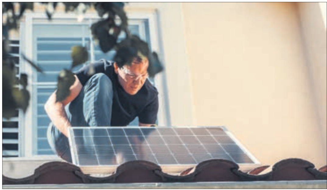
Im neuen Jahr werden viele Richtlinien und Gesetze im Bereich Strom/Heizungen geändert. So müssen Balkon-Solaranlagen nicht mehr beim Netzbetreiber angemeldet werden.

Förderung für Heizungsaustausch: Trotz der unklaren Haushaltslage soll es dabei bleiben: Haushalte erhalten ab 2024 eine höhere Förderung für eine neue Heizung. Neben einer Grundförderung von 30 Prozent gibt es einen Klimageschwindigkeitsbonus von 20 Prozent für alle, die bis 2028 ihre