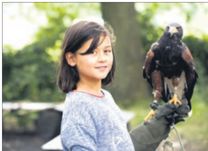
Spielerisch kommen die Kinder auch manchen wilden Tieren näher.