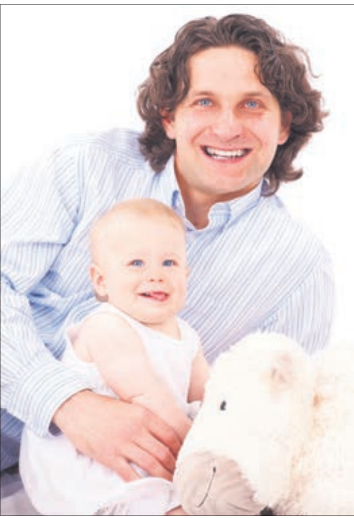
Der Selbstbehalt für unterhaltspflichtige Väter wurde neu berechnet, die sogenannte „Düsseldorfer Tabelle“ angepasst.