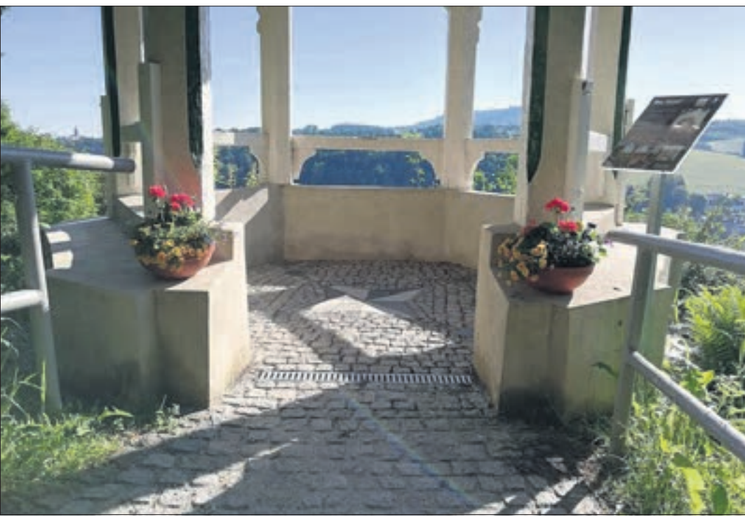
Pfad-Finder Buchholz: Anschaffung von Hinweistafeln und Beschilderungen mit historischem Bezug zum Fortgang des „Historischen Pfads“ durch den Stadtteil Buchholz.