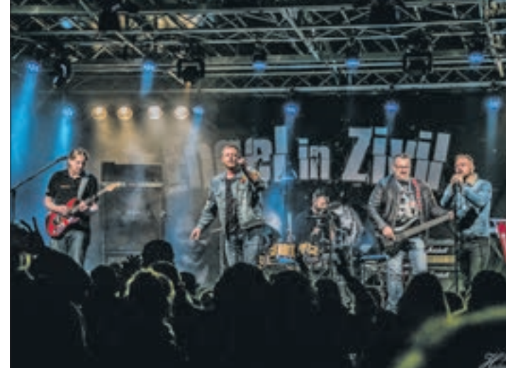
Das neue Jahr startet laut in der „Linde“ Affalter. Am 6. Januar rocken die Jungs von „Engel in Zivil“.

Wir verlosen Karten. Wie Sie gewinnen können, lesen Sie auf www.wochenendspiegel.de im Internet. red