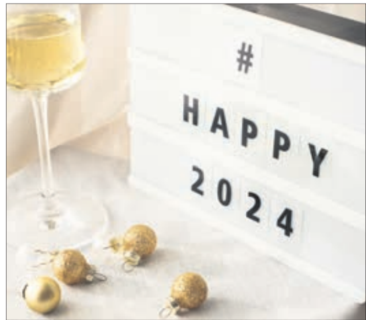
Fürs kommende Jahr sind wieder jede Menge Änderungen vorgesehen. Die Verbraucherzentrale Sachsen gibt hierzu einen Überblick.

Rechtsanwälte und Steuerberater Leichthammer, Scheckel, Breil & Partner Reichsstraße 35, D-09112 Chemnitz Tel.: + 49 - (0)371 - 3 82 48 20 Homepage: www.lsb-partner.de E-Mail: lsb.chemnitz@lsb-partner.de