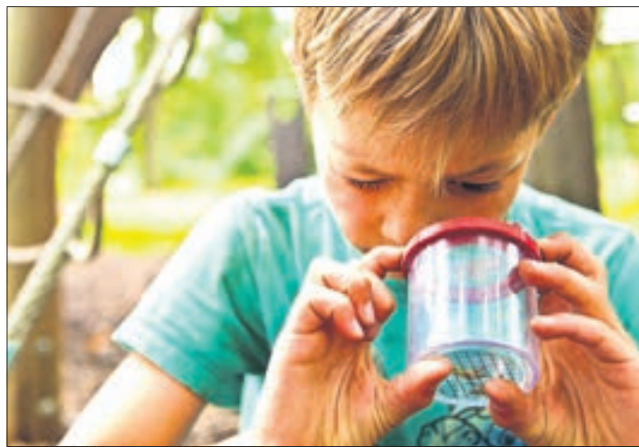
Wichtige Botschaft: Auch die kleinsten Tiere und ihre Bedeutung für die Natur kennenlernen.

Wenn die Ferien zum Abenteuer werden In spannenden Naturcamps können Kinder und Jugendliche viel erleben