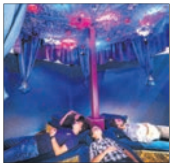
Am Deckenteich kommen Besuchende zur Ruhe und gönnen ihrem Gehirn Entspannung.