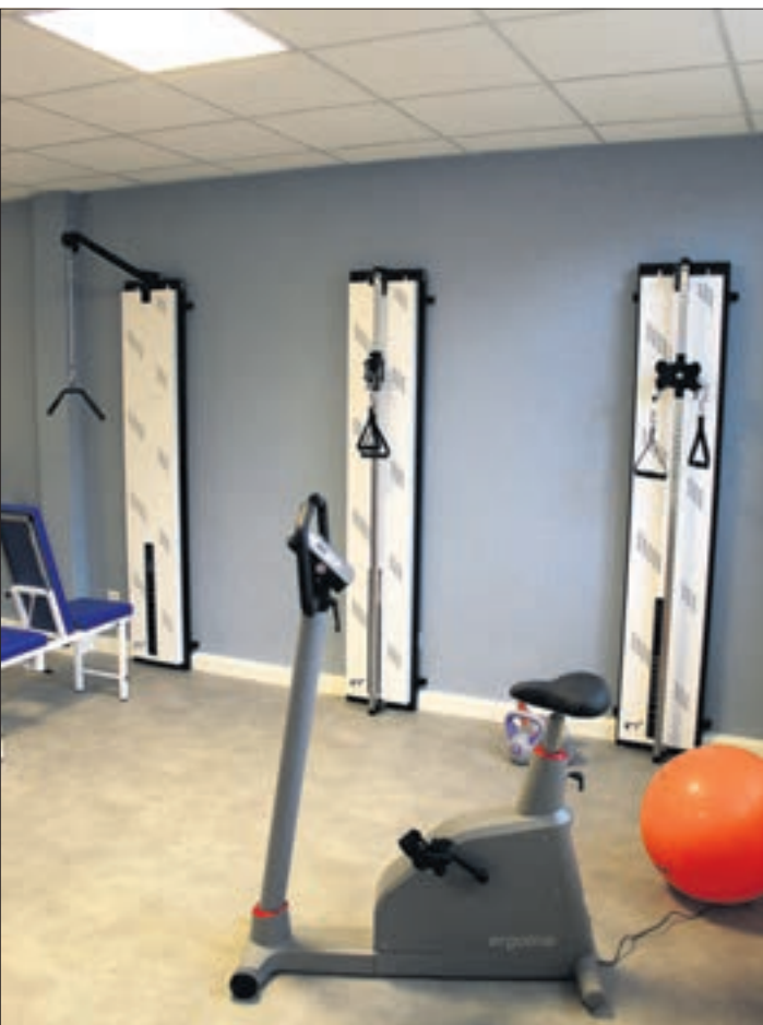
Vielseitiges Trainingsequipment für maßgeschneiderte Therapieprogramme stehen in den frisch renovierten Räumlichkeiten von Physio und Vital Thalheim für ein effektives und ganzheitliches Trainingskonzept bereit.