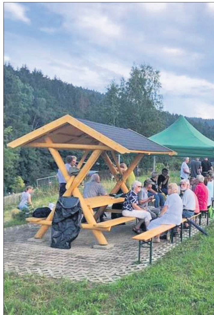
Heimatverein Liederhain Dittersdorf e.V. Schaffung einer Sitzmöglichkeit und Anlegen einer Vogelschutzhecke von der Ortslage Dittersdorf zum unteren Grünwaldweg, Stadt Löbnitz.

Die Mitmachbroschüre erhielten alle Grund- und Förderschulen unseres Kreises sowie die Lehrerbildungsstätte Annaberg-Buchholz des Landesamtes für Schule und Bildung. red