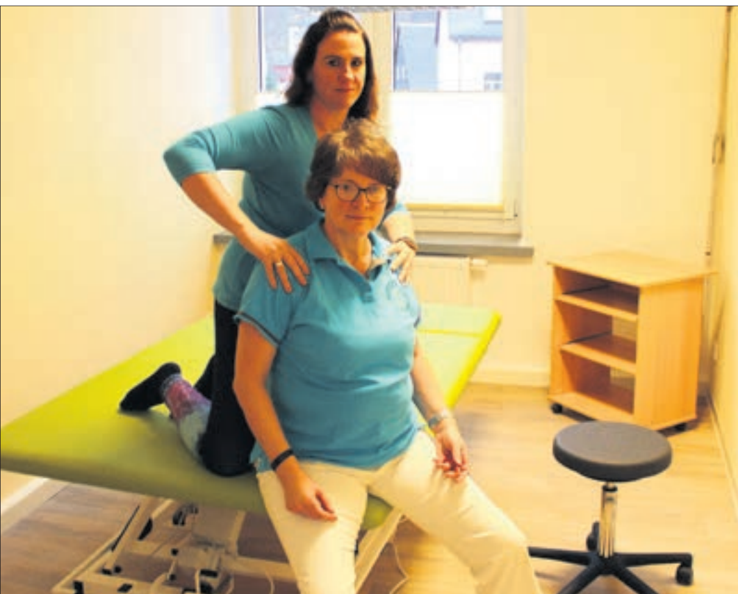
Die neue Bobathliege bei Physio & Vital Thalheim – ein Schlüsselement für fortschrittliche Therapieverfahren.