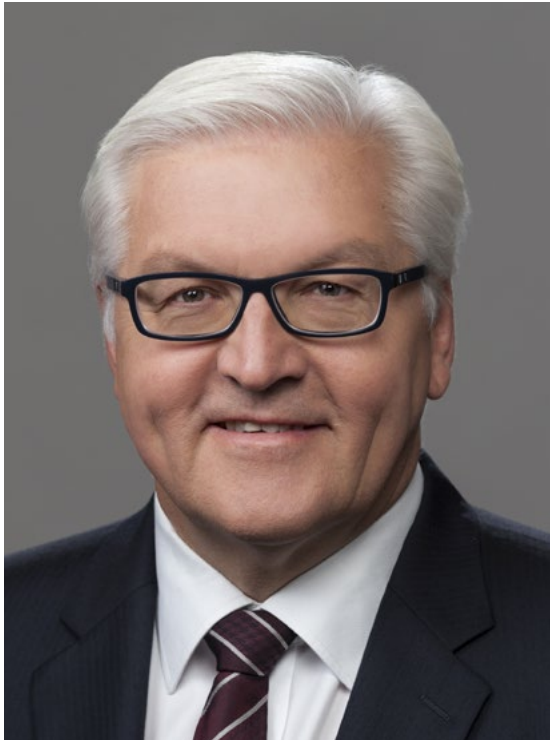
FRANK-WALTER STEINMEIER BUNDESMINISTER DES AUSWÄRTIGEN