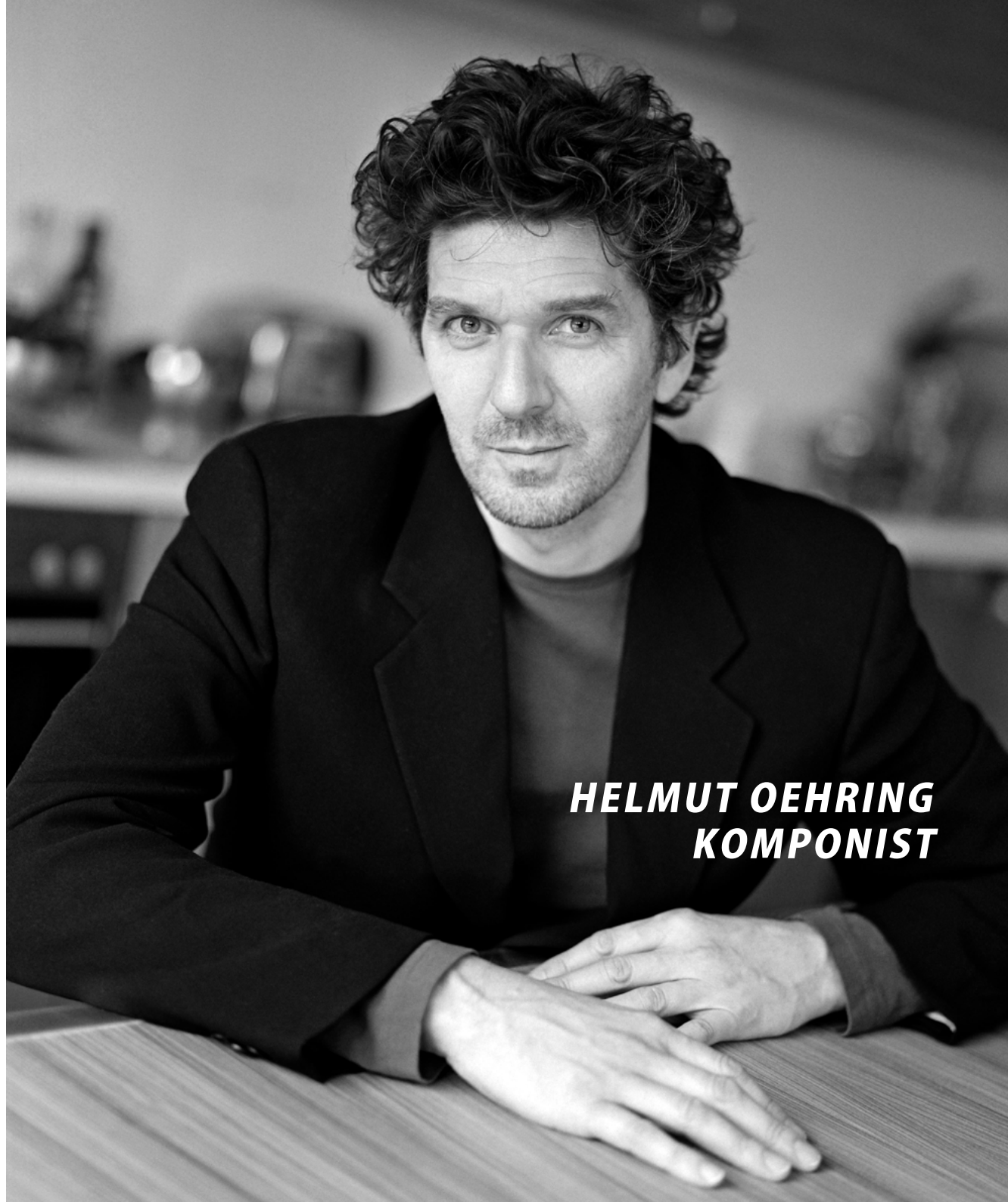
HELMUT OEHRING KOMPONIST