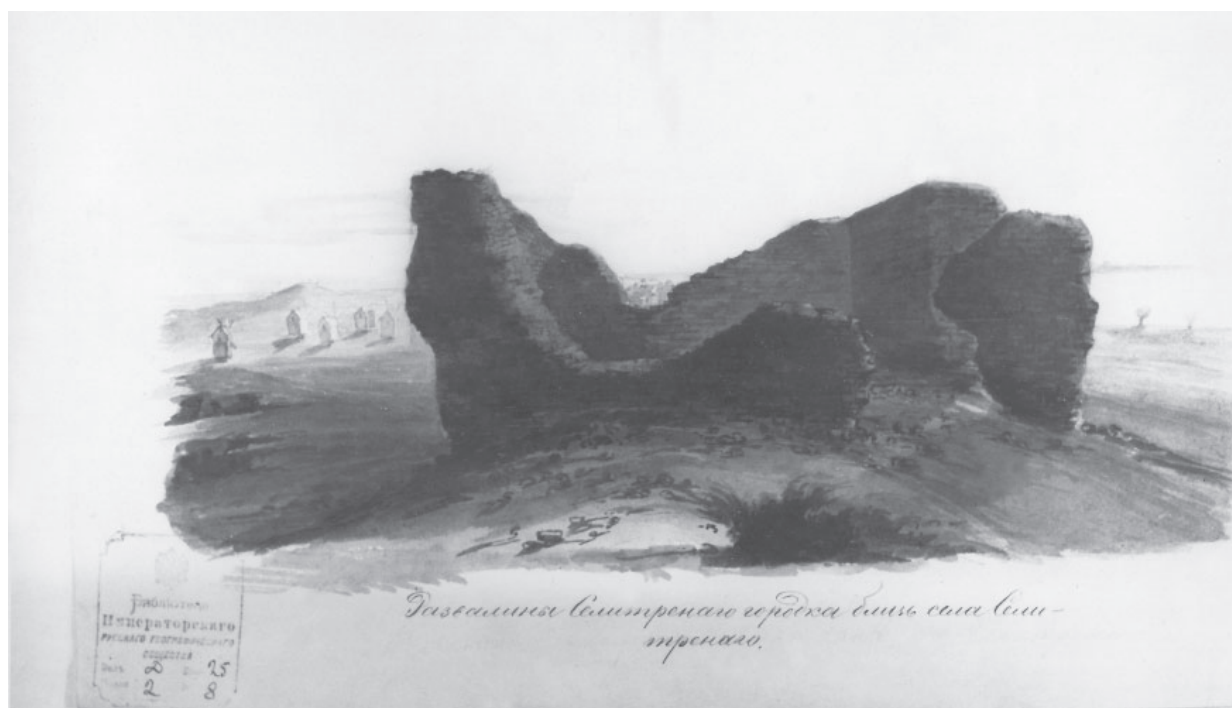
Рис. 1. Селитренное городище. Развалины крепости (гравюра художника Череева экспедиции И.Б. Ауэрбаха, 1854 г.).