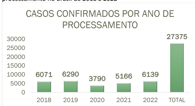
FIGURA 1 – Gráfico dos casos confirmados por ano de processamento no Brasil de 2018 a 2022