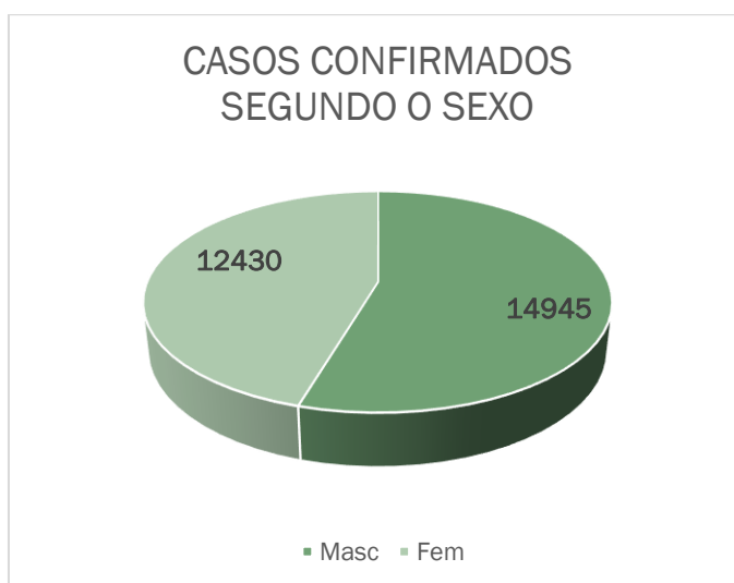
FIGURA 2 – Gráfico dos casos confirmados por sexo no Brasil de 2018 a 2022

Quanto ao sexo, homens foram os que mais registraram notificações com 14.945 casos confirmados (FIGURA 2)