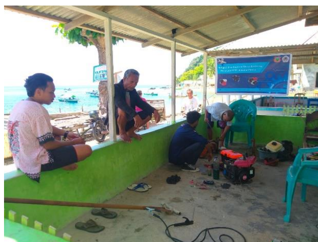
Gambar 4 Masyarakat nelayan mempraktikan secara langsung

Terlihat pada gambar di atas peralatan yang digunakan untuk reprasi mesin sudah memadai, penyediaan alat ini sangat penting untuk melatih skill para nelayan dan menyadarkan nelayan bahwa pentingnya merawat mesin ketinting secara berkala, agar meminimalisir terjadinya kerusakan yang parah pada mesin, selain itu dengan adanya peningkatan pengetahuan serta keterampilan nelayan dalam memperbaiki mesin, kegiatan melaut nelayan dapat lebih produktif (Media, 2022).