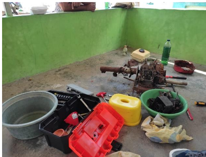
Gambar 3 Peralatan reprasi mesin ketinting

Melalui pendampingan ini dapat meningkatkan kesejahteraan Masyarakat nelayan yang dimana keterampilan yang dibutuhkan dalam memperbaiki mesin ketinting sesuai dengan potensi sumber daya alam dan kebutuhan para nelayan, menurut (Yahya et al., 2021) dengan memberikan bimbingan serta pelatihan yang berorientasi pada kebutuhan social ekonomi Masyarakat nelayan dapat meningkatkan tingkat kesejahteraan khalayak sasaran.