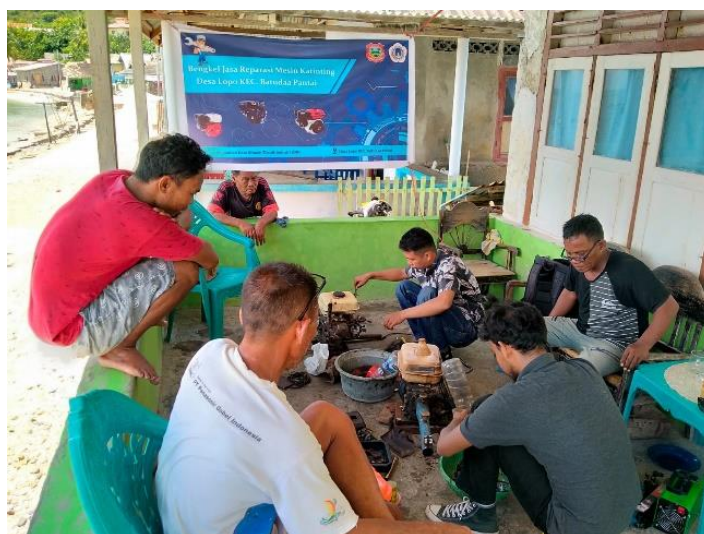
Gambar 2 Pendampingan kepada Masyarakat

Pendampingan pengabdian ini berhasil menciptakan bengkel reparasi mesin ketinting bagi nelayan, dapat dilihat pada gambar dibawah ini Masyarakat sangat antusias dalam mengikuti pendampingan: