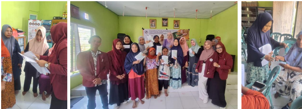
Gambar 7. Proses Pengisian Kuisioner Dan Lembar Pengujian Organoleptik

Dari hasil di atas dapat dilihat bahwa rata-rata peserta penyuluhan menilai baik dan sangat baik materi yang disampaikan, dan dominan dari peserta mendapatkan motivasi dari penyuluhan ini, sehingga mendorong mereka untuk