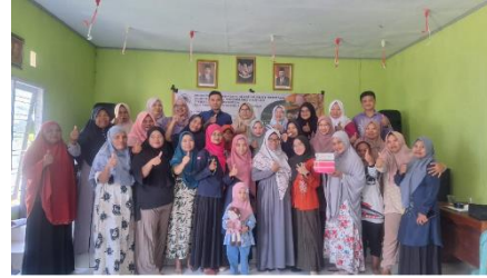
Gambar 4. Foto Bersama Peserta Pelatihan