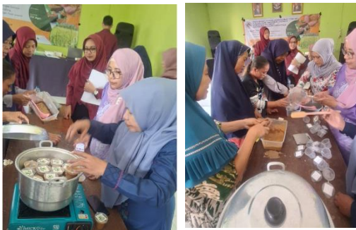
Gambar 3. Kegiatan Pelatihan