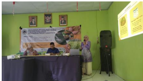
Gambar 2. Proses Penyuluhan

Proses Penyuluhan Berlangsung dalam 2 jam yang dilanjutkan dengan tanya jawab dari peserta pelatihan. Para peserta terlihat banyak yang antusias mengikuti kegiatan penyuluhan, dengan dibuktikan banyak yang menyampaikan pertanyaan karena ketertarikan dengan materi yang diberikan. Proses Penyuluhan dapat dilihat pada gambar di bawah ini.