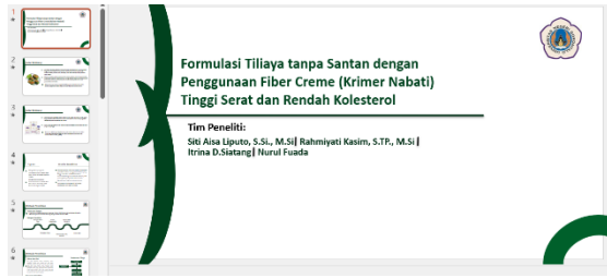
Gambar 1. Materi Penyuluhan

Proses Penyuluhan Berlangsung dalam 2 jam yang dilanjutkan dengan tanya jawab dari peserta pelatihan. Para peserta terlihat banyak yang antusias mengikuti kegiatan penyuluhan, dengan dibuktikan banyak yang menyampaikan pertanyaan karena ketertarikan dengan materi yang diberikan. Proses Penyuluhan dapat dilihat pada gambar di bawah ini.