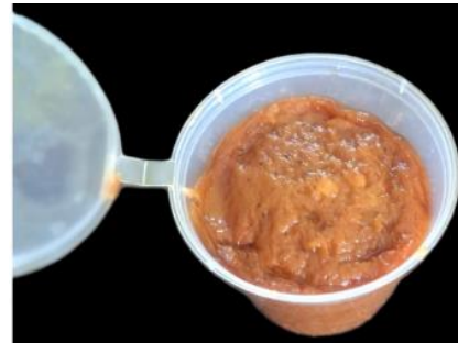
Gambar 5. Produk Tiliaya Tanpa Santan