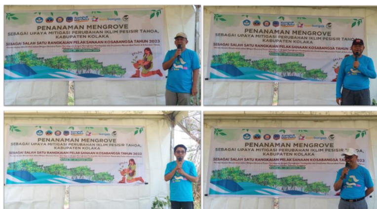
Gambar 2. Pengisi Acara Kegiatan Penanaman Mangrove

juga dipaparkan. Tujuannya adalah untuk meningkatkan kesadaran masyarakat akan pentingnya menjaga lingkungan, terutama bagi mereka yang tinggal di wilayah pesisir. Studi terdahulu, seperti yang dilakukan oleh (Herawati et al., 2022) dan (Dewi et al., n.d.), menunjukkan bahwa pendekatan penyuluhan dan penanaman mangrove dapat meningkatkan pemahaman, keterampilan, dan kesadaran masyarakat tentang pentingnya pelestarian mangrove.