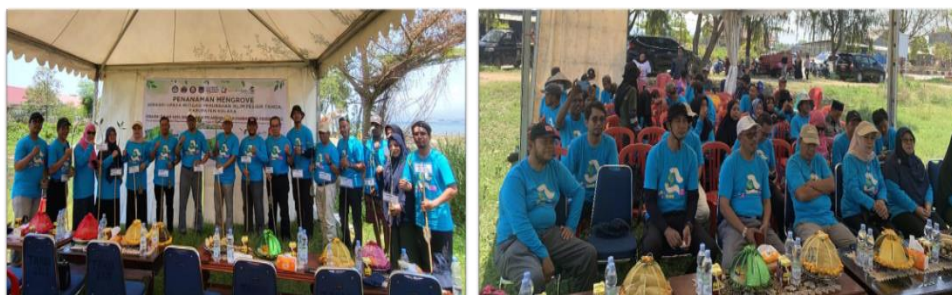
Gambar 3. Kegiatan Sosialisasi

Kegiatan ini melibatkan berbagai elemen masyarakat, termasuk kelompok nelayan Sipatuo, tokoh masyarakat, pemuda, dan warga dari beragam kelompok usia, sebagaimana terlihat dalam Gambar 3.