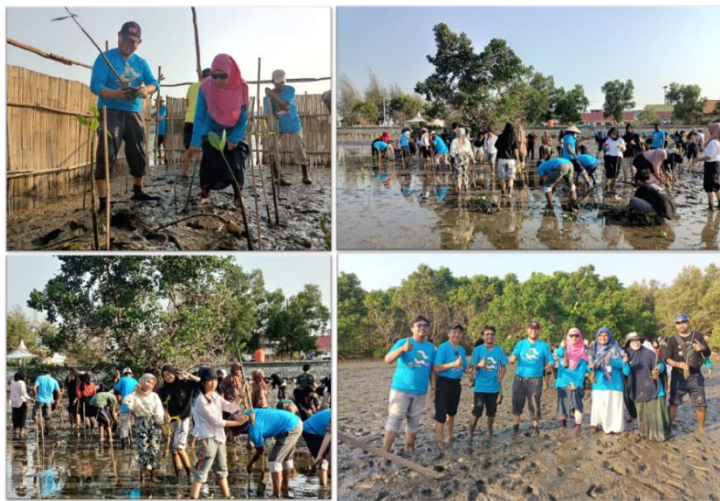
Gambar 4. Penanaman Mangrove

Penanaman mangrove dilakukan segera setelah kegiatan sosialisasi, pada saat air laut sedang surut. Seluruh peserta kegiatan turut serta dalam penanaman mangrove. Sebanyak 300 bibit mangrove ditanam di zona intertidal pantai Kelurahan Tahoa. Proses penanaman dimulai dengan penanaman simbolis oleh rektor USN Kolaka, ketua pelaksana dan pendamping dari Kosabangsa, Kepala Dinas Perikanan Kabupaten Kolaka, dan perwakilan dari kelompok nelayan Sipatuo. Kemudian, penanaman dilanjutkan secara bersama-sama oleh seluruh peserta, seperti terlihat dalam Gambar 4.