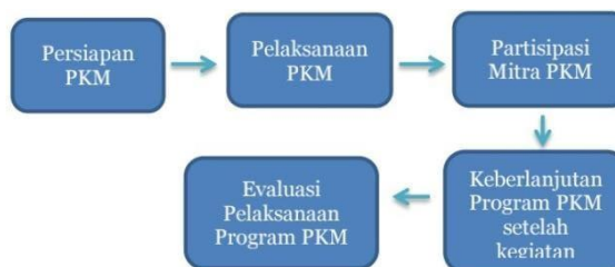
Gambar 1. Langkah melaksanakan solusi pada mitra.

kegiatan dalam keseharian oleh guru, siswa, dan pihak sekolah. Langkah-langkah yang ditempuh dalam melaksanakan solusi atas permasalahan mitra dapat dilihat pada gambar 1 berikut.