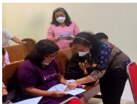
Gambar 2. Pengisian Lembar Pengkajian Tingkat Stres

Kegiatan ini dilaksanakan dengan tiga bentuk kegiatan, yang pertama mendampingi peserta mengisi lembar pengkajian stress yang dapat diisi sendiri oleh peserta dengan pendampingan dari panitia, hingga peserta berhasil menghitung skor yang diperlukan. Tujuan pengkajian tingkat stress ini dilakukan agar peserta mengetahui tingkat stress yang dihadapinya saat ini, sehingga peserta bisa mengetahui intervensi yang bisa dilakukan untuk mengatasi stress yang dihadapi. Lembar pengkajian yang digunakan adalah Perceived Stress Scale yang direkomendasikan oleh pembawa materi, seperti terlihat pada Gambar 2.