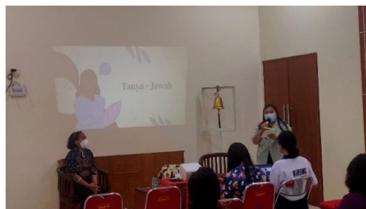
Gambar 4. Sesi Diskusi Tanya Jawab

Kegiatan yang terakhir yaitu sesi diskusi antara peserta dan pembawa materi. Panitia menyiapkan waktu 30 menit untuk melakukan diskusi terkait materi yang disampaikan, dan memberikan kesempatan untuk bertanya kepada pembawa materi jika ada materi yang tidak dipahami, seperti terlihat pada Gambar 4.