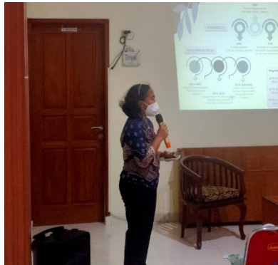
Gambar 3. Paparan Materi

menghadapi stres berdasarkan hasil dari pengkajian tingkat stress. Tujuan dari mengajarkan teknik manajemen stress ini adalah menambah pengetahuan peserta dari segi psikomotor sehingga peserta dapat melakukan intervensi sendiri ketika dihadapkan dengan stress ringan. Jika level stres sudah berada pada tingkat berat, berarti peserta membutuhkan pertolongan medis, seperti terlihat pada Gambar 3.