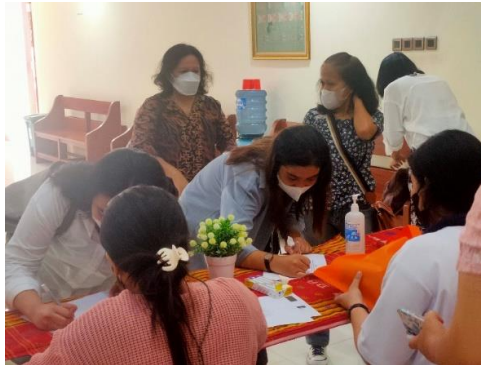
Gambar 1. Registrasi Peserta

Kegiatan diawali dengan registrasi peserta yang datang untuk mengikuti kegiatan ini, terdaftar sejumlah 50 peserta. Peserta antusias dalam mengikuti kegiatan ini, namun tidak semua peserta yang datang tepat waktu, seperti terlihat pada Gambar 1.