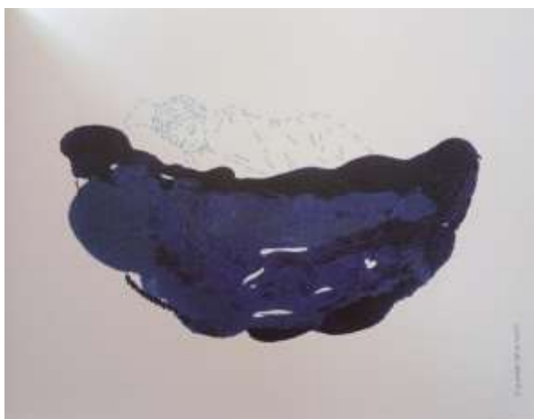
Figura 2. Ilustración de Mónica Gutiérrez Serna: el guardián de la noche