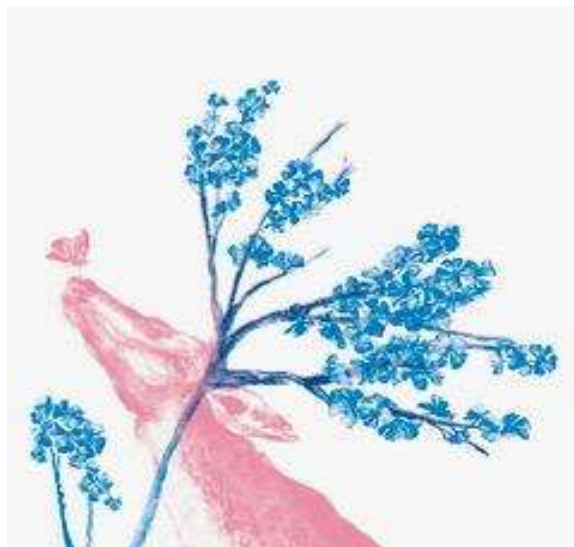
Figura 6. Ilustración superpuesta de Mariana Alcántara para Natura