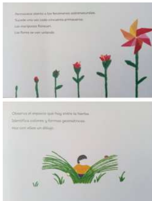
Figura 5. Ilustraciones de Andrés López para El espacio entre la hierba

Fuente: ilustraciones reproducidas con permiso de la editorial Alboroto