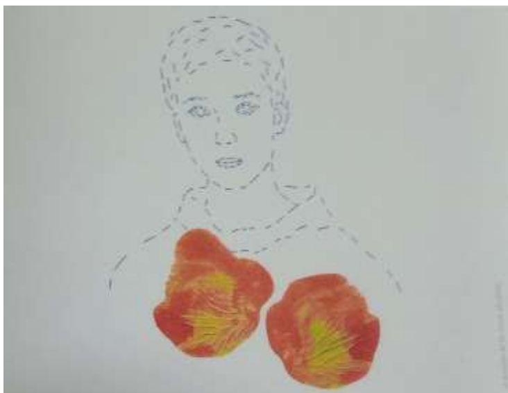
Figura 3. Ilustración de Mónica Gutiérrez Serna: el guardián de las cosas olvidadas