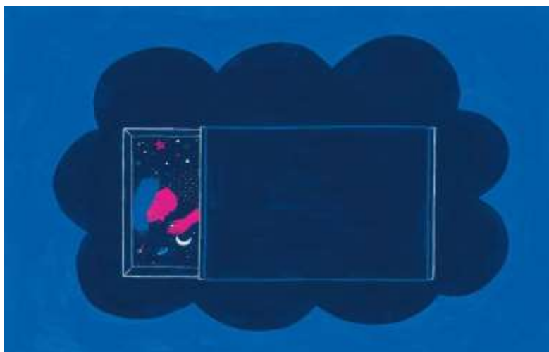
Figura 1. Ilustración de Karina Letelier para Espantamiedos