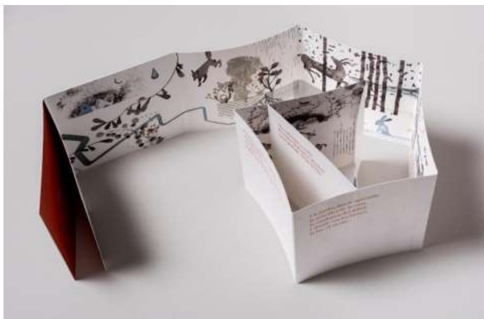
Figura 4. Diseño de Isidro Ferrer para el libro-acordeón Un jardín

Fuente: ilustración proporcionada por Isidro Ferrer con permiso de la editorial A Buen Paso