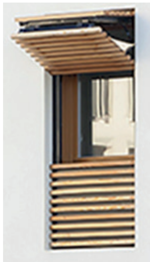
Figura 6 – Proteção para janela, brise camarão

Desse modo, foi adotado um beiral contínuo de 80cm na coberta, uniformizando esteticamente a residência. Brises horizontais em todas as janelas dos quartos (FIGURA 5), pergolado na janela da cozinha (FIGURA 6) e uma extensão em pergolado da varanda do pavimento superior (FIGURA 7) para a sala de estar, além do uso de teto verde na garagem.