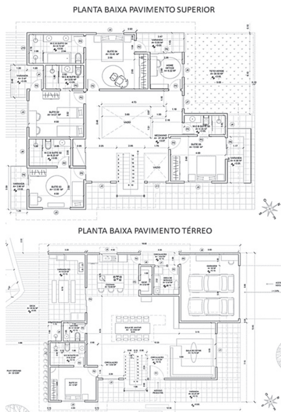
Figura 4 – Plantas Baixas da residência unifamiliar