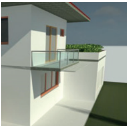
Figura 8 – Perspectiva 3D da extensão da varanda