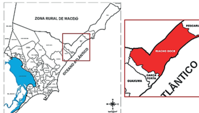
Figura 2 – Mapa de Maceió, AL com a localização do bairro Riacho Doce

O terreno de intervenção está localizado no bairro de Riacho Doce, loteamento Reserva da Garça na cidade de Maceió, AL, a qual é caracterizada pelo clima quente e úmido. A cidade possui duas estações bem definidas: o inverno, com maior precipitação (800mm) e o verão, com pouca precipitação (316mm), tal questão é advinda de sua proximidade à linha do equador. Vale ressaltar, que essa região possui uma temperatura média anual de 25,10°C, segundo as normais climatológicas de 1981 – 2010 do Instituto Nacional de Meteorologia – INMET (BRASIL, 2010), além de ter uma predominância de ventos vindos do nordeste (verão) e sudeste (presente em todo o ano).