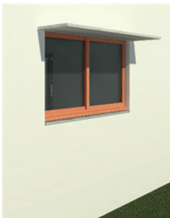
Figura 7 – Perspectiva 3D referente a proteção da cozinha