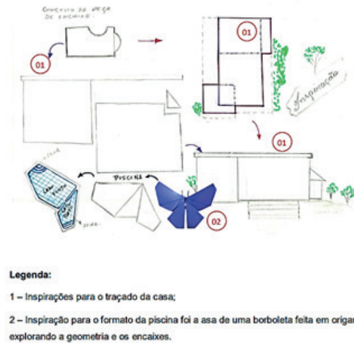
Figura 1 – Desenvolvimento do conceito do projeto