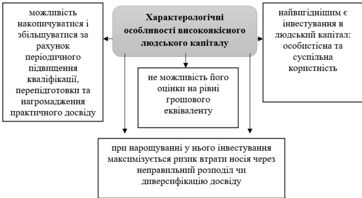
Рис.1. Характерологічні особливості високоякісного людського капіталу

вихідними ідеями, відмінними від власних. Саме такий «когнітивний дисонанс» проблематизує розгортання критичного мислення та перегляд власних вихідних поглядів.