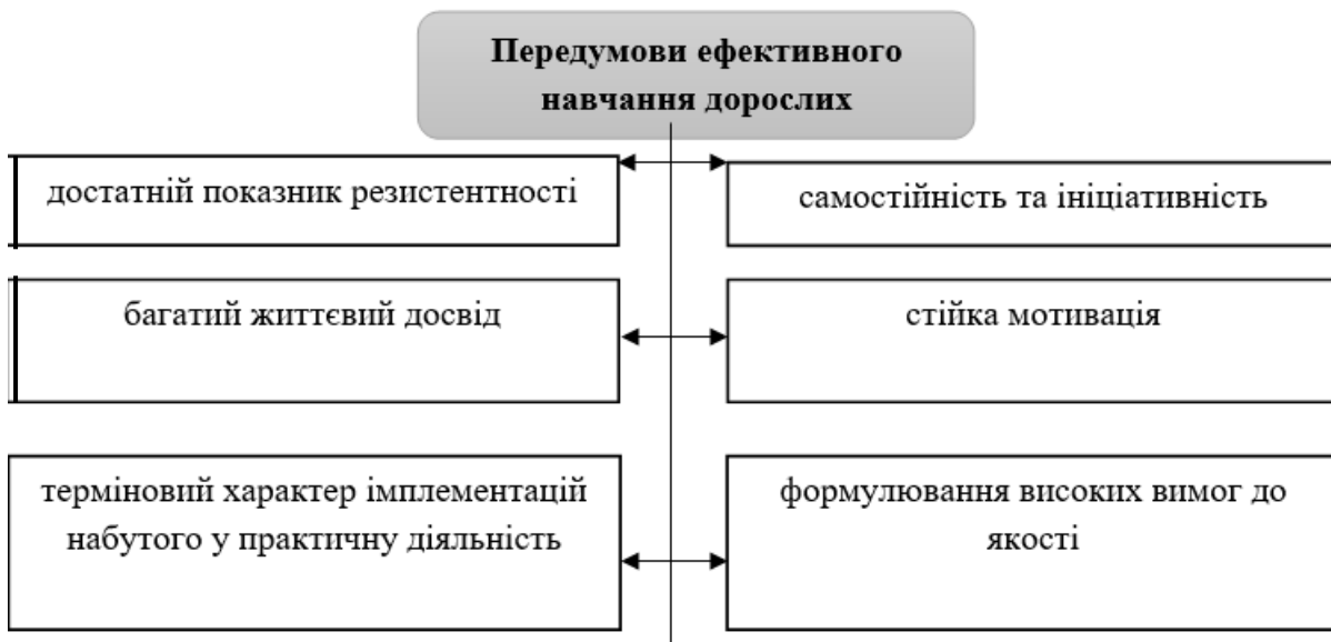
Рис. 2. Передумови ефективного навчання дорослої цільової аудиторії

На основі урахування вищевикладеного стає зрозумілим, що організація навчання дорослих є доволі складним завданням, яке потрібно реалізовувати на засадах цілої низки ключових педагогічних принципів, до переліку яких зокрема можемо віднести: практикоцентрованості, індивідуалізації, колективної співпраці та інші. Важливим у цьому ключі, також, залишається завдання побудови навчальної діяльності на засадах консультативної взаємодії, що уможливує урахування потенційних запитів кожного представника дорослої цільової аудиторії.