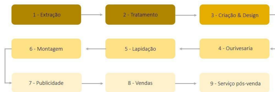
Figura 1: Fluxograma do setor joalheiro.

Este estudo apontou como necessário a análise da cadeia de valor da joalheria tradicional para identificar se as atividades desenvolvidas estão impulsionando a economia criativa da região. De forma esquemática, o cenário da produção de joias tradicionais do Pará foi proposto por Schreiner (2014), no qual é possível ver as fases do fluxo da cadeia do setor joalheiro (Figura 1).