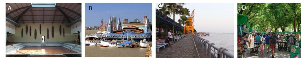
Figura 3: A - Espaço São José Liberto; B - Mercado Ver-o-Peso; C - Estação das Docas e D - Praça da República.

Os espaços públicos visitados foram selecionados pelo seu reconhecimento na comercialização de produtos regionais: o Espaço São José Liberto (ESJL), o Ver-o-Peso, a Estação das Docas, e a Praça da República (Figura 3). Como resultado das primeiras visitas técnicas, foi desenhado um mapa dos mais representativos produtores de artesanato/acessório de moda e joias paraenses.