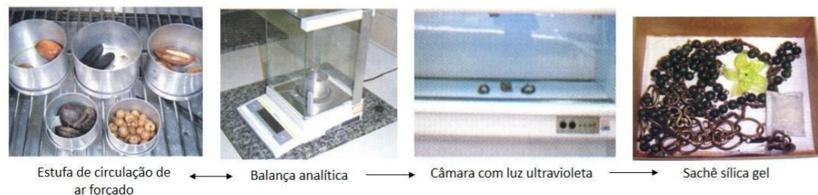
Figura 6: Fluxograma de tratamento da EMBRAPA.

A EMBRAPA, instituição de pesquisa referência no estado para o tratamento de sementes amazônicas, desenvolveu em 2009, um protocolo (Figura 6) focado na etapa de secagem da matéria-prima para o uso em adornos. Isso ocorre porque, segundo a pesquisadora da instituição, é necessário rebaixar o teor de umidade ao nível de 2% a 3% para que não haja mais atividade microbiana.