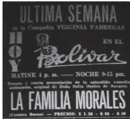
Imagen 3. Publicidad de la Compañía de Virginia Fábregas en 1943