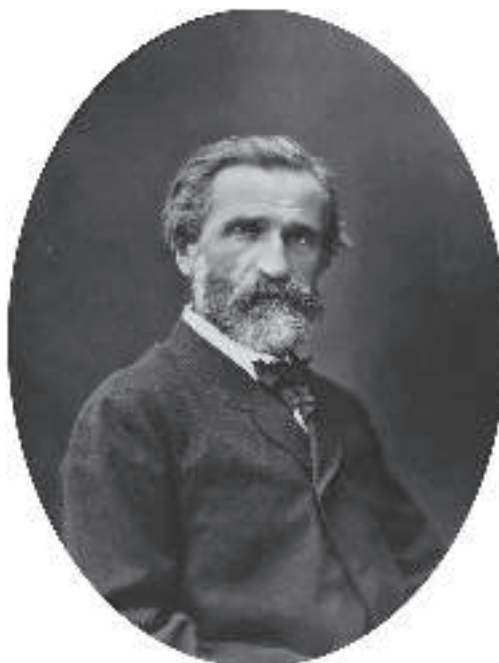
Giuseppe Verdi (1813-1901)

Este panorama cambió con Richard Wagner (1813-1883), el gran maestro de la ópera romántica alemana, cuya figura sigue provocando reacciones enfrentadas. El aprecio que Hitler sentía por su obra, el antisemitismo de Wagner y la patriotería de las aliteraciones de sus textos lo han convertido en un personaje ambiguo. Wagner toma los temas de sus dramas musicales del mundo de las leyendas nórdicas. Su obra más importante es la tetralogía El anillo de los Nibelungos ; Tristán e Isolda , Los maestros cantores de Nuremberg y Parsifal son los títulos de otras de sus óperas. Además, su imagen está ligada al rey Luis II de Baviera y a su delirante y patética inclinación a la teatralización de su propia persona, que culmina en la instauración de un culto para el que se construyó un santuario en Bayreuth: el Festspielhaus . Su