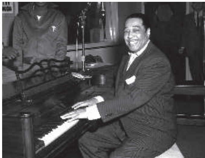
Duke Ellington (1899-1974)

éxtasis corporal se pone de manifiesto en el hecho de que la música se haya apoderado también de la cultura juvenil. El pop es nuestro rey e impone su dominio sobre las distintas tribus, clanes y clubes. Cada uno de ellos cuenta con sus propios rituales, su estética, sus drogas y sus señas de identidad. Techno , hiphop , drum and base , bandas que recuerdan a los Rolling Stones de Mount Rushmore, boy-groups , girlie-bands ... la lista sería interminable.