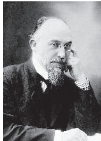
Erik Satie (1866-1925)

al collage y hacia una música que habla de sí misma. El caos sonoro reinante se convierte para él en modelo de una combinación dispar de sonidos en los que la música se comenta a sí misma. Así, se empieza imitando a la perfección el trino de un pájaro, que después se convierte en el motivo musical; se intercala una orquesta de instrumentos de viento a modo de fondo sonoro, y se mezcla lo banal con lo artístico. El conjunto se enmarca en una sonoridad expresiva que parece extraída del inconsciente y que refleja el sentimiento de desarraigo del compositor. Mahler se sentía triplemente apátrida: como bohemio en Austria, como austriaco entre alemanes y como judío en todo el mundo. Por eso no es extraño que acudiese al diván de Freud. Allí pudo comprender el significado de una experiencia de su infancia: cuando su padre volvió a maltratar a su madre, el pequeño Gustav huyó desesperado de la casa y encontró refugio en un músico callejero que cantaba una canción popular. La asociación de esa música alegre con el sufrimiento personal fue decisiva e invirtió los ideales de belleza de la tradición.