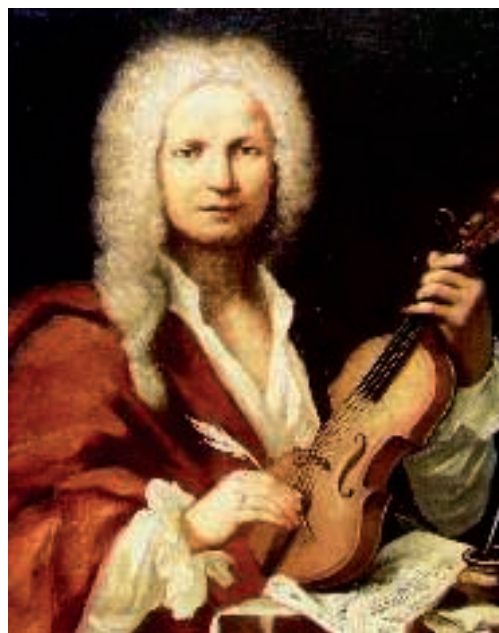
Antonio Vivaldi (1678-1741)

Una de las bases de la música barroca es la denominada doctrina de las emociones, que ya conocemos por la literatura. A partir de ella se establecieron corresponden-