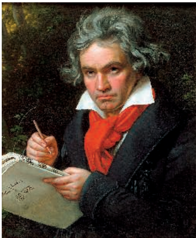
Ludwig van Beethoven (1770-1827)

Si Mozart representa el paso del compositor de la corte al artista que trabaja de forma independiente, Ludwig van Beethoven (1770-1827) personifica la libertad del artista genial. Admirado como pianista, con la ayuda de diversos mecenas Beethoven logra establecerse con rapidez como compositor independiente. Muy pronto empieza a perder oído para acabar completamente sordo, una enfermedad que lo aísla y le obliga a componer únicamente de cabeza, algo nada fácil. Si los músicos anteriores habían aprendido el arte de componer y lo habían practicado como un oficio, las pretensiones de Beethoven iban mucho más allá: él se proponía unir sentimiento y mensaje humanista en una música muy elaborada desde el punto de vista formal. Tal como demuestran sus libros de notas, sus composiciones están siempre precedidas de muchos estudios. En ocasiones trabaja durante años en una misma pieza: naturalmente, la calidad alcanzada en estos casos es muy superior. Crea la música como arte autónomo, ignorando lo que espera de ella una cultura aristocrática superficial. Su música está escrita con más exactitud que, por ejemplo, la de Mozart, pues mientras que este último permite a los solistas un