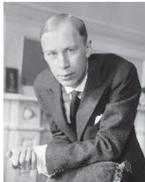
Sergei Prokofiev (1891-1953)

Al mismo tiempo, con sus Gymnopédies y Gnossiennes (títulos dadaístas carentes de sentido) compuso una música de una belleza sobrenatural, pero completamente antirromántica. Satie fue acogido con simpatía por Adorno.