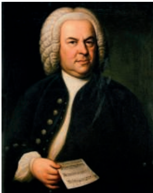
Johann Sebastian Bach (1685-1750)

de Pascua, y al Oratorio de Navidad se le identifica con esta época tanto como al típico árbol navideño. Bach procedía de una familia muy dotada para la música. Inicialmente se dio a conocer como organista y tuvo su primer empleo en Arnstadt/Mühlhausen, antes de convertirse en organista de la corte de Weimar. El momento culminante de su carrera profesional fue su actividad como maestro de capilla en la corte de Köthen. Allí nació buena parte de su música profana, incluidos los famosos Conciertos de Brandenburgo . En 1723, Bach pasó a ser organista y director del coro de la Iglesia de Santo Tomás en Leipzig, lo que representó para él un descenso tanto desde el punto de vista económico como social: Bach acostumbraba quejarse de la falta de aceptación de la muerte que mostraba la gente de Leipzig, pues solía recibir dinero por el acompañamiento musical en los entierros. Al mismo tiempo, en Leipzig tuvo la oportunidad de componer sus famosas pasiones y oratorios. Bach no entendía su actividad como la producción artística de un genio, sino como un trabajo artesanal realizado dentro de un mundo regido por Dios.