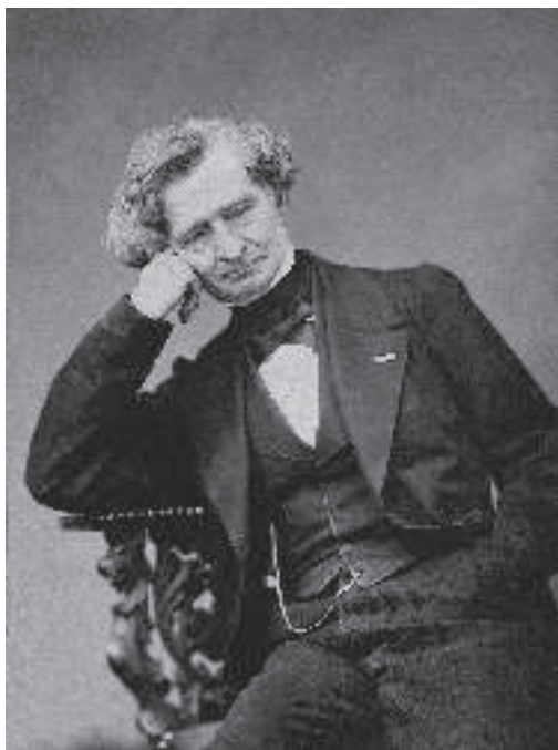
Hector Berlioz (1803-1869)

podía decirse con una sinfonía ya lo había dicho él, lo que provocó la búsqueda de nuevas formas musicales y una lucha entre renovadores y conservadores. La crítica consideró como conservador a Johannes Brahms (1833-1897), cuyo problema era que sus sinfonías sonaban como las de Beethoven. Los renovadores propusieron soluciones diversas.