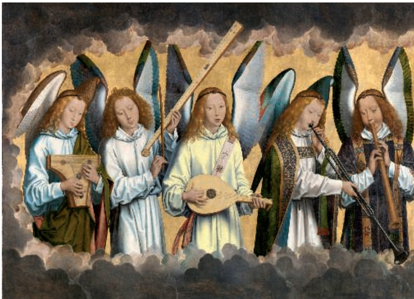
Panel izquierdo del tríptico “Ángeles músicos”, 1480, de Hans Memling. Koninklijk Museum voor Schone Kunsten, Amberes, Bélgica.