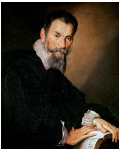
Claudio Monteverdi (1576-1643)

taba nuevas formas para su teatro nacional. Los músicos empezaron a trabajar para la corte, suministrando la música para sus grandes espectáculos.