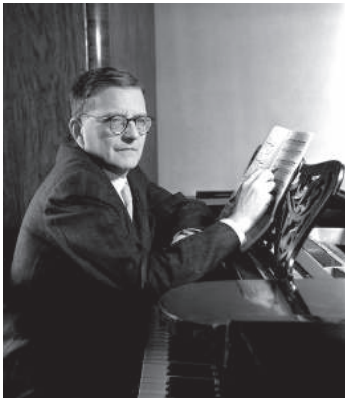
Dimitri Shostakovich (1906-1975)