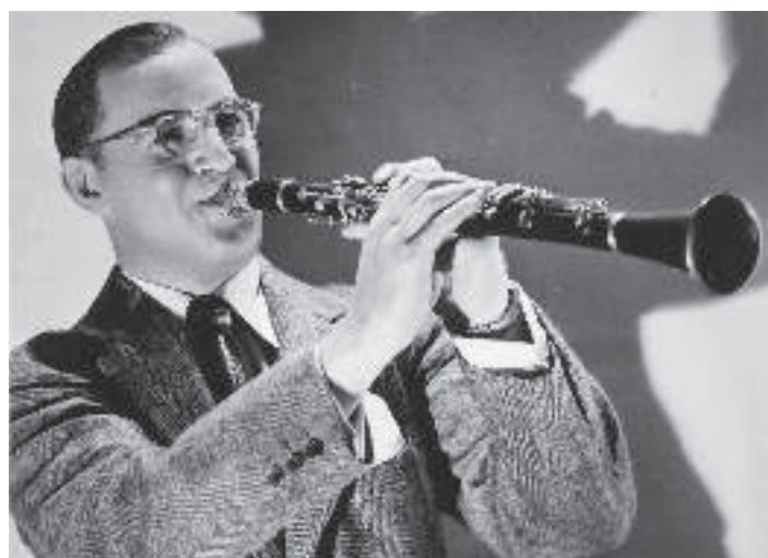
Benny Goodman (1909-1986)

La última moda es combinar toda esta variedad. El lema es “cross over”: virtuosos del jazz que tocan música clásica, orquestas clásicas que tocan pop , tenores aclamados como si fueran estrellas del pop y que incluso cantan las canciones de estos, folclore nacional y sonido urbano unidos en una world-music . Los límites entre música seria y música ligera se difuminan. Al mismo tiempo, la música es hoy un fenómeno comercial que está en manos de la industria de la cultura. En el siglo XX la industria irrumpió en el ámbito de la música gracias a dos inventos: el disco y la radio, es decir, gracias a la posibilidad de difundir masivamente la cultura. De este modo nació una cultura musical democrática en la que todos tienen acceso a cualquier tipo de música. La industria del ocio mueve millones y opera en todo el mundo con alta tecnología. Como en la isla encantada de La tempestad de Shakespeare, el mundo está lleno de sonidos. Algunos añorarán los tiempos en los que la música todavía era un arte; pero lo cierto es que hoy, en cada gran almacén, Pitágoras vería cumplido su sueño de la música de las esferas. ✨