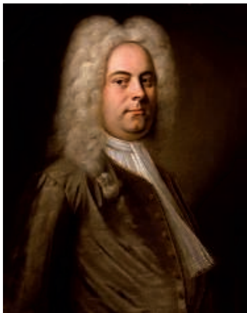
Georg Friedrich Händel (1685-1759)

del mismo modo que a una danza rápida ha de sucederle una lenta para que los bailarines puedan recobrar el aliento, en la suite y en la sinfonía se alternan las partes rápidas y las partes lentas.