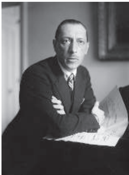
Igor Stravinski (1882-1971)