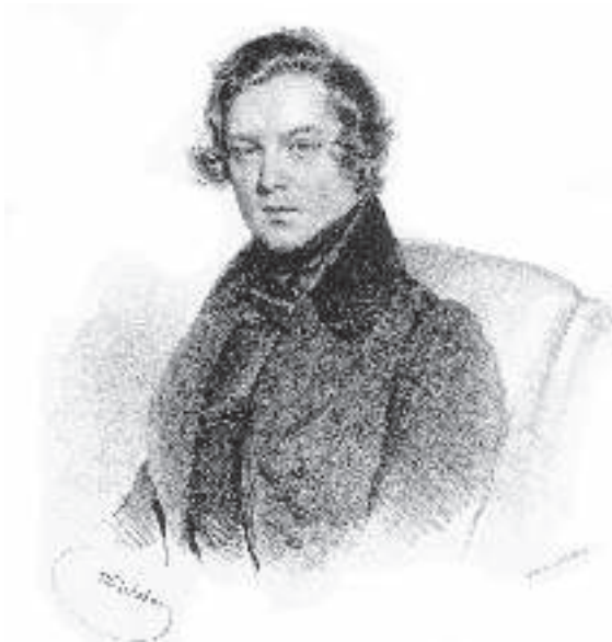
Robert Schumann (1810-1856)