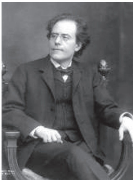
Gustav Mahler (1860-1911)