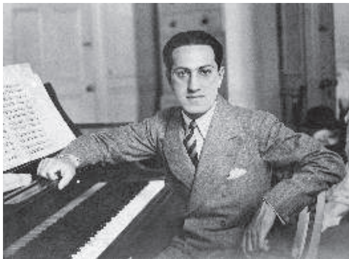
George Gershwin (1898-1937)

éxtasis corporal se pone de manifiesto en el hecho de que la música se haya apoderado también de la cultura juvenil. El pop es nuestro rey e impone su dominio sobre las distintas tribus, clanes y clubes. Cada uno de ellos cuenta con sus propios rituales, su estética, sus drogas y sus señas de identidad. Techno , hiphop , drum and base , bandas que recuerdan a los Rolling Stones de Mount Rushmore, boy-groups , girlie-bands ... la lista sería interminable.