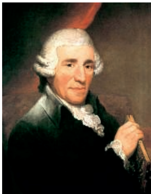
Joseph Haydn (1732-1809)

Joseph Haydn (1732-1809) todavía dependió de los encargos de los nobles, aunque le dejaron bastante margen de libertad para desarrollar prácticamente en solitario las formas fundamentales de la música clásica: la sinfonía en tanto que música orquestal;