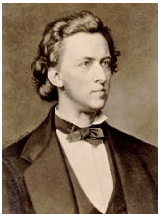
Frédéric Chopin (1810-1849)

Un grupo de artistas rusos reunidos en torno a Mijail Glinka (1804-1857) se quedaron en el Este y se inspiraron en el folclore y en las leyendas rusas: se llamaron