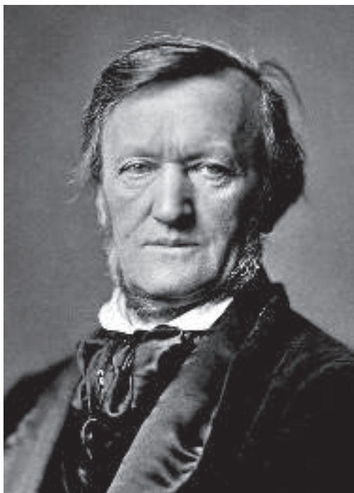
Richard Wagner (1813-1883)

esposa Cosima Wagner, hija del compositor Franz Liszt, proporcionó los medios necesarios. El Festspielhaus pasó luego a manos de su hijo, el director de orquesta Siegfried Wagner, y de este al nieto, el administrador Wieland Wagner. En el culto a Wagner esta dinastía encuentra su comunidad de fieles.