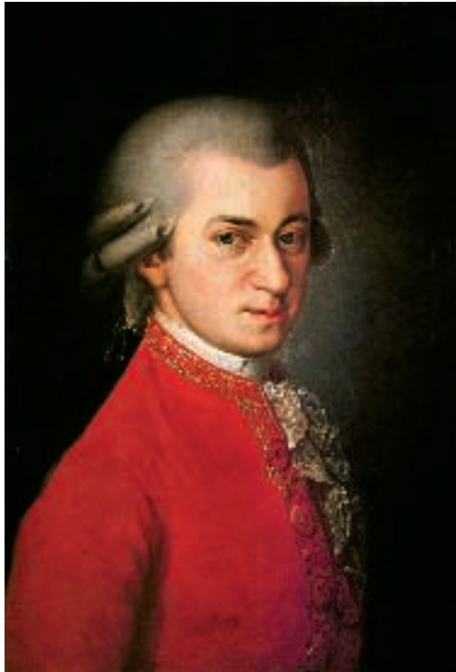
Wolfgang Amadeus Mozart (1756-1791)

su padre Leopold, que también era músico, lo presentó en todas las cortes de Europa, donde daba conciertos con su hermana mayor; a los nueve años compuso su primera sinfonía, y a los trece era ya concertista en el arzobispado de Salzburgo. Tras viajar a Italia y París, Mozart se instaló en la meca de la música, Viena, donde se independizaría de la corte y se convertiría en un artista autónomo. En Viena vivió de los conciertos, de los encargos y de las clases que impartía. Y no vivía mal, pues incluso llegó a fundar una familia con su esposa Constanze. Fue uno de los solistas mejor pagados de la capital, se procuró un caballo y frecuentó los círculos más exclusivos. En 1784 ingresó en la logia masónica y compuso para ella.