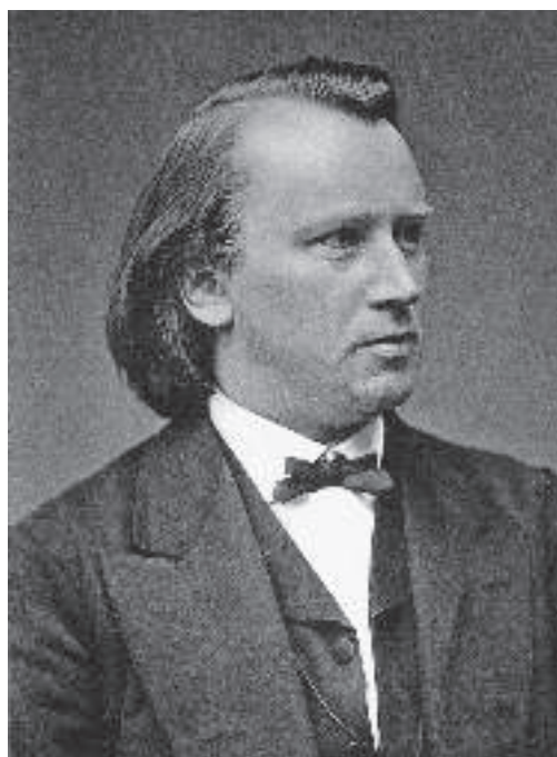
Johannes Brahms (1833-1897)

Por otra parte, la herencia de Beethoven pesaba demasiado sobre los compositores que le sucedieron. Todo lo que