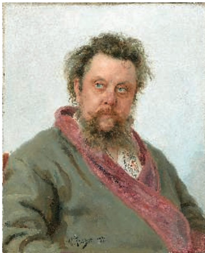
Modest Mussorgski (1839-1881)

a sí mismos “el gran grupito”. De los miembros de este grupo conocemos a Modest Mussorgski (1839-1881), sobre todo por sus Cuadros de una exposición , una obra que ilustra ejemplarmente cómo la pintura puede inspirar la música. Se trata de piezas pianísticas que explotaron hasta tal punto el sonido del piano, que muchos músicos posteriores se sintieron animados a instrumentar los cuadros: desde la versión orquestal de Ravel hasta una versión rock, pasando por una temprana versión electrónica. Wassily Kandinsky aportaría más tarde otros cuadros. Pero estas piezas pianísticas son más bien una excepción en la obra de Mussorgski. “El gran grupito” produjo fundamentalmente óperas inspiradas en el folclore ruso. Otro de los miembros de la llamada “escuela nacional rusa” es Piotr Tchaikovski, al que sin embargo conocemos menos por sus once óperas que por sus tres ballets: El lago de los cisnes ,