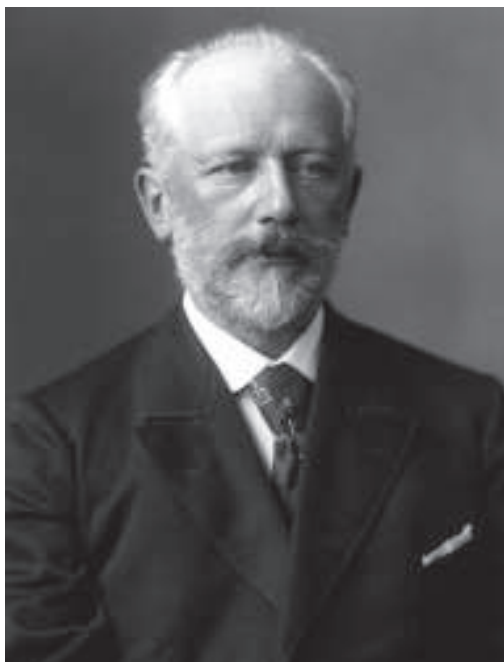
Piotr Tchaikovski (1840-1893)

La Bella Durmiente y Cascanueces . De esta manera desembocamos en la tercera respuesta a la crisis de las formas musicales del siglo XIX: la ópera.