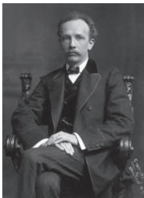
Richard Strauss (1864-1949)

de poder expresar musicalmente el sonido resultante de servir cerveza en un vaso, y de una forma tan exacta que incluso podía reconocerse de qué clase de cerveza se trataba. La debilidad de la música descriptiva es eviden-