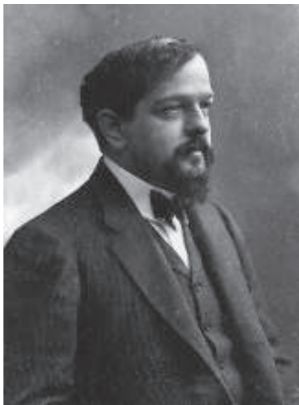
Claude Debussy (1862-1918)