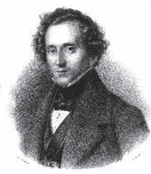
Felix Mendelssohn (1809-1847)

te, pues, como en algún momento la música instrumental debe poder arreglárselas sin explicaciones, resulta imprescindible conocer de antemano el contenido extramusical para comprender de qué se trata. Sin este saber previo, la música no pasa de ser una sucesión de momentos más o menos enérgicos, más o menos rápidos y más o menos dramáticos, cuyo conjunto no nos deja más que signos de interrogación.