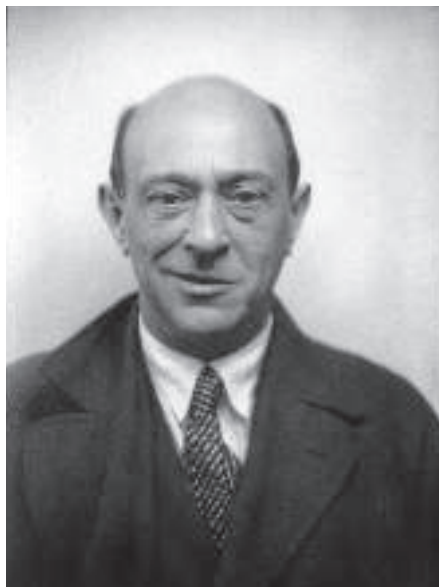
Arnold Schönberg (1874-1951)