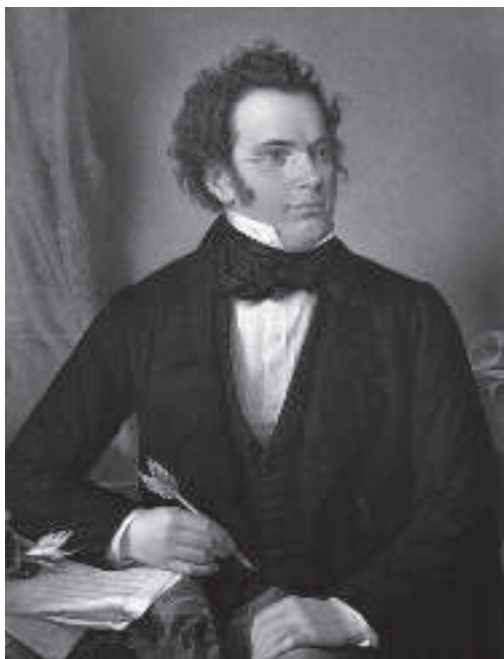
Franz Schubert (1797-1828)

tensa y ensimismada de Beethoven y en sus cabellos desordenados. No es una casualidad que sus bustos hayan sido tan vendidos.