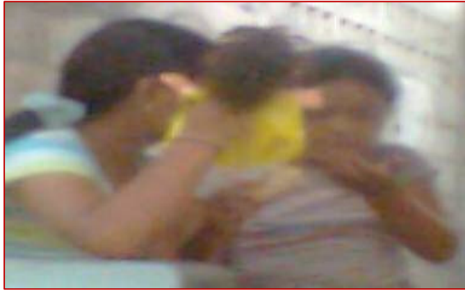
Las niñas jugando con sus títeres

También es perceptible que las respuestas resultan contradictorias, cuando asocian el participar con el opinar, pero reconocen que sus opiniones no son tenidas en cuenta.