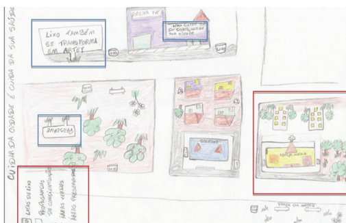
Figura 3. “Cuidar da cidade é cuidar da saúde”

Na figura 3 ainda podemos notar o desenvolvimento de legenda do mapa, com seus signos e significados e destaque a algumas toponímias – pontos de referência – da cidade de Cajazeiras-PB como a igreja matriz e sua praça, destaques em vermelho. Seguindo procedimentos semelhantes, o aluno 2 desenvolve mapa mental apresentando suas propostas de soluções para os problemas urbanos. Ele utiliza do recurso de hachuras 4 para destacar os elementos da legenda. Destaca, a partir de sua representação espacial, maior atenção ao centro da cidade.