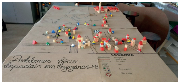
Figura 2. Maquete mental.