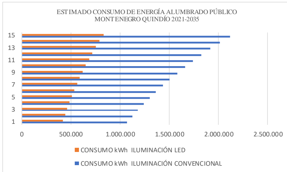
Figura 2. Estimativo del consumo de energía para el SALP

De acuerdo con XM, en Colombia el factor de emisión de CO 2 por generación eléctrica del Sistema Interconectado es de 0.381 t de CO 2 por megavatio hora (MWh).