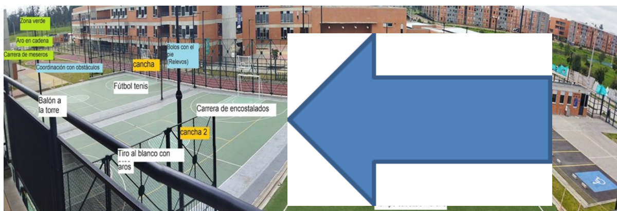
Figura 2. Área de las canchas

Los planos de la institución permiten ver y caracterizar los escenarios en los cuales los niños y niñas del colegio Parques de Bogotá realizan su experiencia del recreo estos espacio son las dos canchas múltiples cada uno limitando por un lado con la cancha sintética y por el