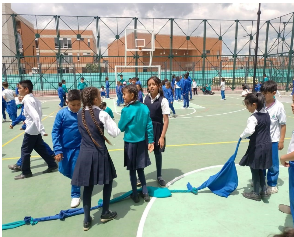
Figura 4. Registro fotográfico 10 de octubre de 2022 grado quinto-tercero.

Siguiendo también hay algunos factores que generan como se muestra en esta imagen el cansancio de jugar lo mismo, también manifiestan aburrimiento del lugar, ya que está haciendo mucho sol y que pues no tienen ningún elemento para jugar.