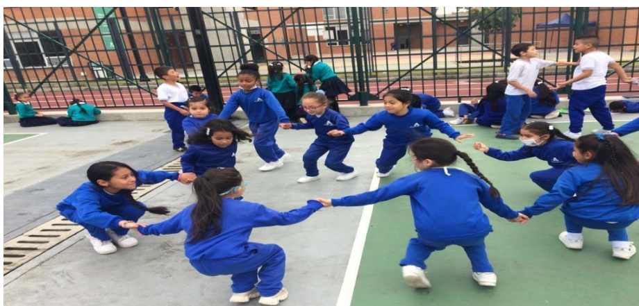
Figura 6. Registro fotográfico 11 de octubre de 2022 grados Primero, tercero).

Otros, a su vez ubicados en el centro de la cancha, participan en el juego en su gran mayoría niñas de primero, hay dos niñas de tercero que se metieron a este juego llamado “la piña colada”, dando giros, agarrados de brazos entonan sonsonete repetitivo “el corazón de la piña se va envolviendo arriba, arriba, abajo...bajo... bajo”, este juego sonoro lo alternan con diferentes retos que le va colocando el grupo, toma de decisiones como aporte al desarrollo integral desde el manejo de las competencias socioemocionales