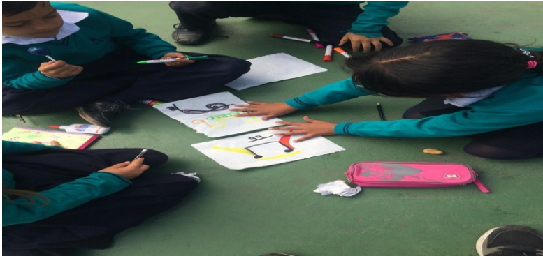
Figura 10. registro fotográfico 13 de octubre de 2022 grado primero.

Una muestra del disfrute de la experiencia del recreo es la panorámica de esta, en la relación con el espacio, el cuerpo en movimiento, actividad física, desarrollo motor y cognitivo.