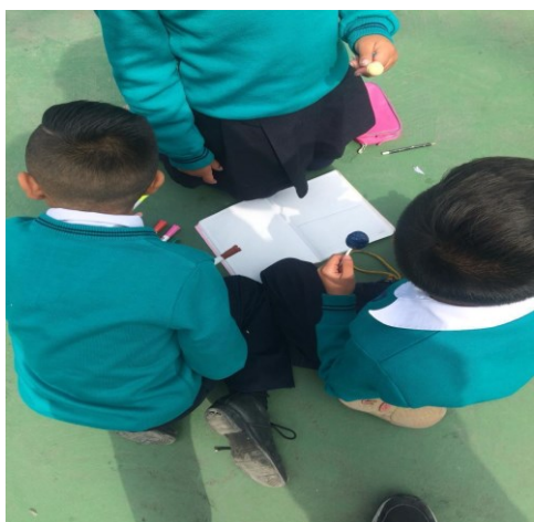
Figura 18. registro fotográfico 24 de octubre de 2022 grado primero

Por consiguiente el uso de materiales, se evidencia también cuando los estudiantes reutilizan los elementos que entregan en los refrigerios y que cogen como juguete explorando sonidos y experimentado el material , se observa también a la otra estudiante analizando la posibles usos que le puede dar Figura 19. registro fotográfico 24 de octubre de 2022 grado primero.