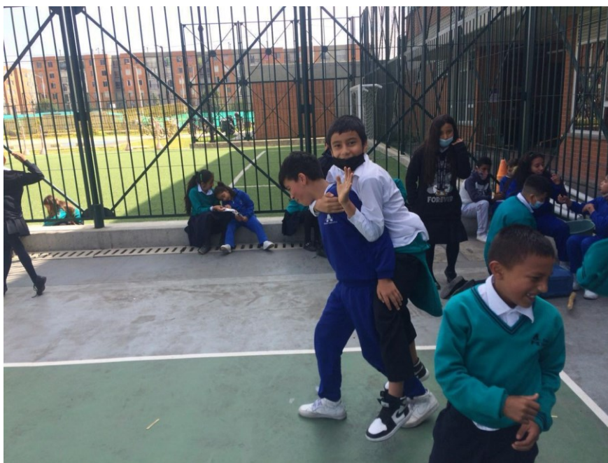
Figura 12. registro fotográfico 14 de octubre de 2022 grado quinto).

Además en este mismo espacio confluyen otros estudiantes de grado quinto que se apropian de este espacio casi en la esquina periférica de la cancha del colegio para practicar las canciones que aprenden en las sesiones de música y del club con elementos de uso común, como canecas palos de escobas palmas y su propia voz, elementos interesantes que le apuntan al desarrollo integral.