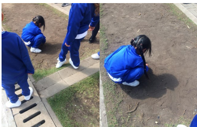
Figura 17. registro fotográfico 18 de octubre de 2022 grado primero.

En estas experiencia se pasa de la práctica de fútbol ligada a la actividad física, al desarrollo psicomotriz que genera esta experiencia de la niña de grado primero, ya que utiliza elementos naturales como la tierra, elemento que le potencia la expresión , la motricidad fina y gruesa utilizando los dedos como pinceles para representar según la estudiante un tiranosaurio rex ya que le gustan mucho sus características y el sonido que identifica a este animal extinto y también expresa que los dinosaurios se extinguieron por una fuerte explosión que el cielo se volvió negro y que los dinosaurios no tenían que comer y que por esta razón ya no existen.