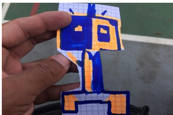
Figura 9. Registro fotográfico 13 de octubre de 2022 grado primero).

Estos mismos creadores de primero, les encanta compartir con elementos concretos, cuadernos, colores, marcadores un pequeño grupo de discusión, a mi sentir la música es el eje central de este tipo de creaciones voluntarias que permiten la expresión, el gusto y disfrute del lenguaje artístico que potencia el desarrollo integral.