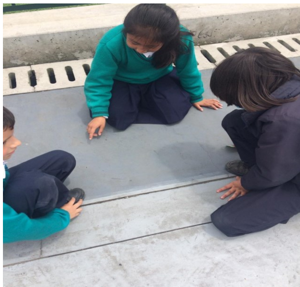
Figura 8. registro fotográfico 13 de octubre de 2022 grado quinto.

En otra experiencias dos estudiante de primero con sus propias grafías, y con mucha inventiva, generan juegos simbólicos de representación de ideas o imágenes que parten de su realidad, en este caso la expresión de los estudiantes es que ese es mi amuleto de poder en el descanso y que todo iba estar bien, algo así como un elemento de protección entendí yo