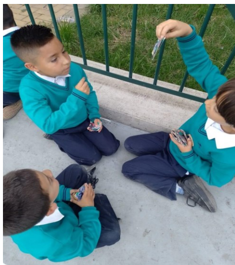
Figura 3. Registro fotográfico 10 de octubre de 2022.

En el registro fotográfico realizado se evidencia que los niños y niñas de grado tercero se ubican en diferentes espacios de la cancha, cerca de la zona verde a jugar cartas de - de yu gi oh, un juego que permite a ellos establecer normas, crear identidades y poderes estableciendo Juegos de roles donde se potencia la zona de desarrollo próximo y la meta cognición.