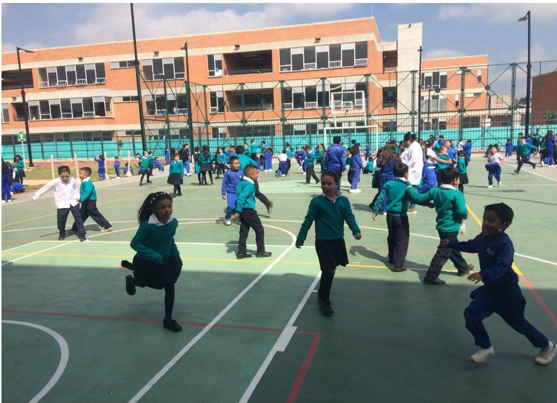
Figura 11. registro fotográfico 14 de octubre de 2022 grado primero, tercero, quinto).

Una muestra del disfrute de la experiencia del recreo es la panorámica de esta, en la relación con el espacio, el cuerpo en movimiento, actividad física, desarrollo motor y cognitivo.