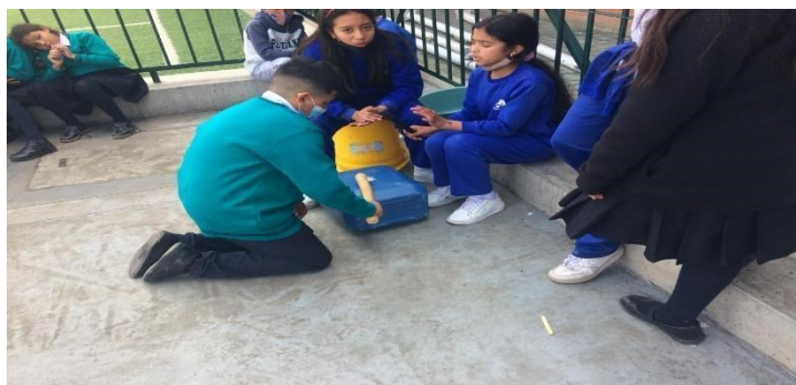
Figura 13. Registro fotográfico 14 de octubre de 2022 grado quinto.

En otra periferia de la cancha se observa una “reunión de chicas” Así lo expresan ellas– se les pregunta ¿qué están haciendo? -responden-hablando de cosas del colegio, de cosas de la casa, a veces de niños que nos molestan y así profe ¿cuándo nos van a dejar jugar con balones y otras cosas?, mi respuesta, es una buena idea para divertirse les dije, pero la verdad no tengo ninguna respuesta para ellas, preguntare y luego les cuento cual es la respuesta del coordinador.