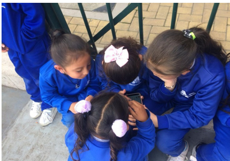
Figura 7. registro fotográfico 13 de octubre de 2022 grado quinto).

Por otro lado, en contraposición a lo anteriormente mencionado, estos tres estudiantes están apreciando algo, me acerco ¡oh sorpresa! están observando una araña, les preguntó ¿qué le ven? las patas responden y (...) ¿cómo se mueve? ¿Para donde se mueve? , genera muchas hipótesis en los estudiantes, lo cual les permite afianzar procesos de pensamiento y desarrollo cognitivo en torno a este animal, en este proceso demuestra interés por las ciencias naturales y por la concepción del medio ambiente.