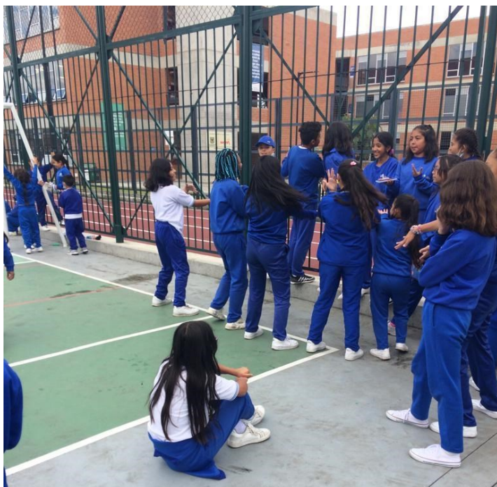
Figura 6. registro fotográfico 12 de octubre de 2022 grado quinto).

En cuanto a los niños de primero, en esta ocasión se muestra el caso de la estudiante que manifiesta “que la mama la dejo traer este celular porque era viejito” a mi parecer no lo es, esa la impresión que me quedo, pero bueno -las niñas se quedan, cacharriando las funciones del celular, en especial la búsqueda del juego de una pelota de colores que van sacando una