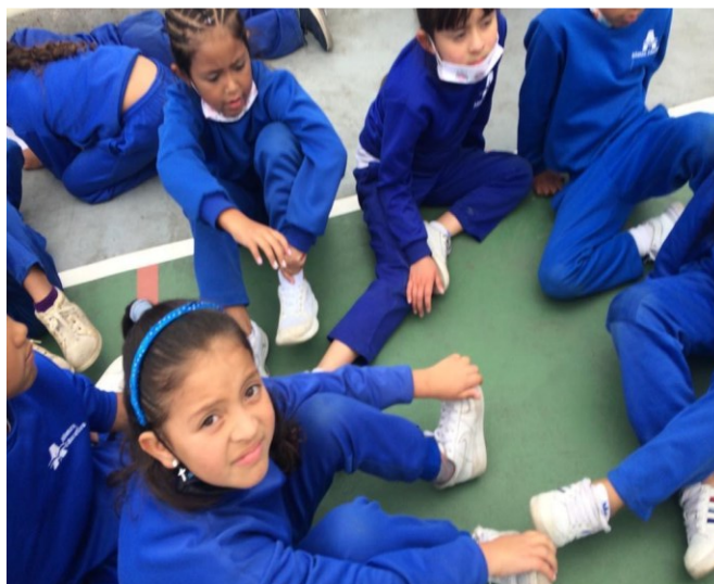
Figura 5. Registro fotográfico 11 de octubre de 2022 grado quinto-tercero

Otros, a su vez ubicados en el centro de la cancha, participan en el juego en su gran mayoría niñas de primero, hay dos niñas de tercero que se metieron a este juego llamado “la piña colada”, dando giros, agarrados de brazos entonan sonsonete repetitivo “el corazón de la piña se va envolviendo arriba, arriba, abajo...bajo... bajo”, este juego sonoro lo alternan con diferentes retos que le va colocando el grupo, toma de decisiones como aporte al desarrollo integral desde el manejo de las competencias socioemocionales