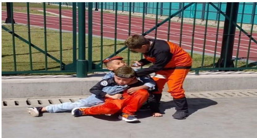
Figura 21. registro fotográfico 31 de octubre de 2022 grado primero