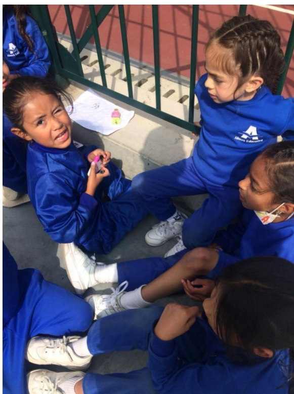
Figura 20. registro fotográfico 24 de octubre de 2022 grado primero.

Para cerrar este apartado, el juego de roles se demuestra aún más, el día de Halloween, en la imagen se asocia el “que ser” y el “qué hacer”. También en estos espacios convergen algunos aspectos negativos, con las acciones del cómic-animé “Naruto” donde se evidencia manejo de fuerza, así como brusquedad, el golpe, la violencia que de alguna manera se observa en este, la emoción del estudiante al realizar dichas acciones.