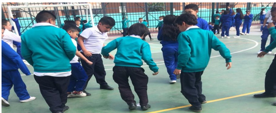
Figura 16. registro fotográfico 19 de octubre de 2022 grado quinto.

En estas experiencia se pasa de la práctica de fútbol ligada a la actividad física, al desarrollo psicomotriz que genera esta experiencia de la niña de grado primero, ya que utiliza elementos naturales como la tierra, elemento que le potencia la expresión , la motricidad fina y gruesa utilizando los dedos como pinceles para representar según la estudiante un tiranosaurio rex ya que le gustan mucho sus características y el sonido que identifica a este animal extinto y también expresa que los dinosaurios se extinguieron por una fuerte explosión que el cielo se volvió negro y que los dinosaurios no tenían que comer y que por esta razón ya no existen.