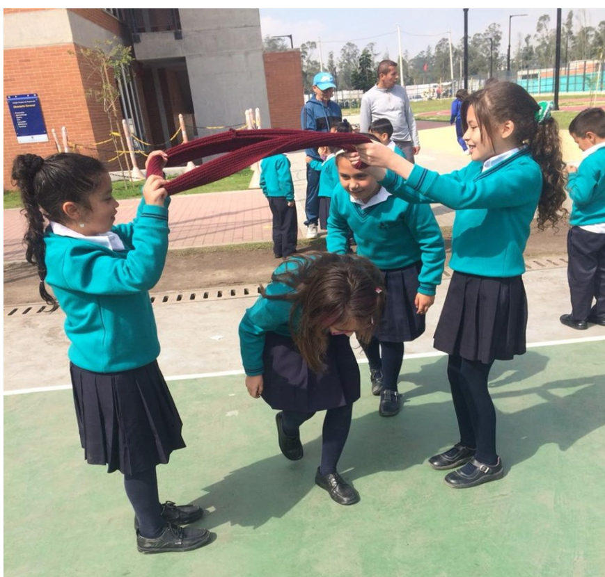
Figura 15. Registro fotográfico 18 de octubre de 2022 grado tercero, quinto.

También aparecen para esta experiencia del recreo los deportes, los estudiantes de quinto que, se reúnen en grupo y toman la decisión de jugar fútbol con una pelota hecha en papel, se evidencia en los estudiante el gusto por la actividad física de contacto, utilizando fuerza y habilidades coordinativas y el trabajo colaborativo, aunque actualmente en el año 2023 se