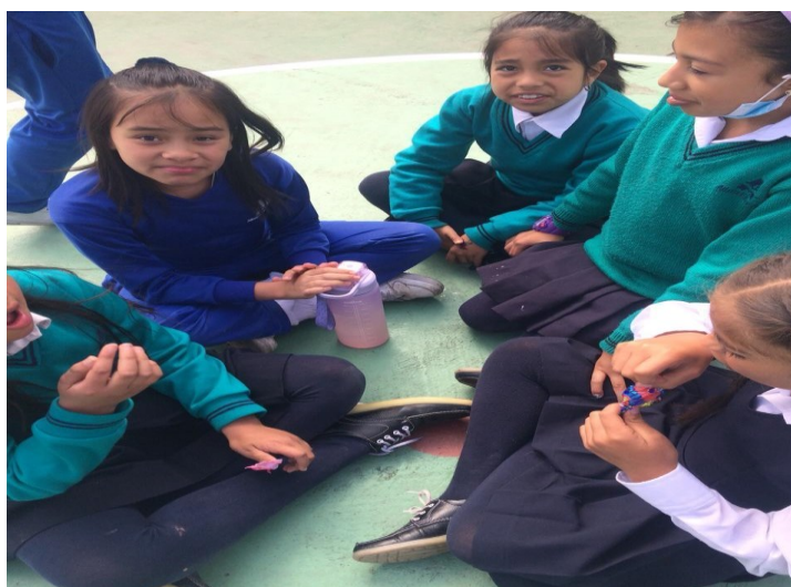
Figura 14. registro fotográfico 17 de octubre de 2022 grado quinto.

En otra periferia de la cancha se observa una “reunión de chicas” Así lo expresan ellas– se les pregunta ¿qué están haciendo? -responden-hablando de cosas del colegio, de cosas de la casa, a veces de niños que nos molestan y así profe ¿cuándo nos van a dejar jugar con balones y otras cosas?, mi respuesta, es una buena idea para divertirse les dije, pero la verdad no tengo ninguna respuesta para ellas, preguntare y luego les cuento cual es la respuesta del coordinador.