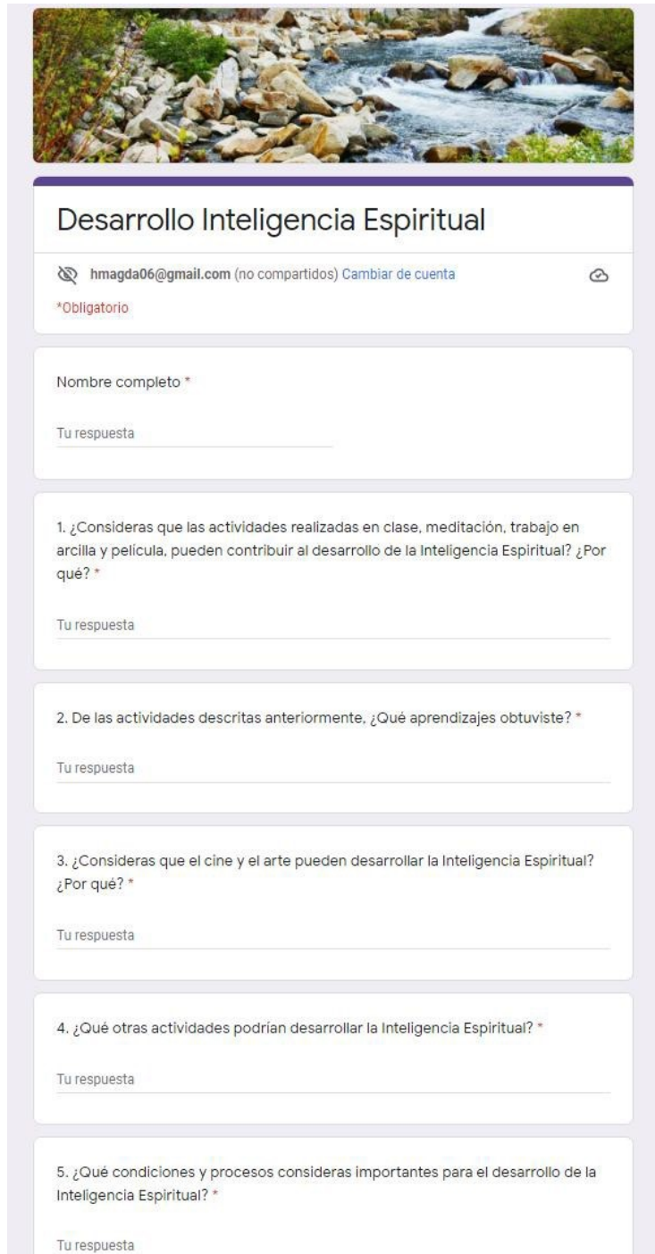
Ilustración 9. Formulario Desarrollo de la Inteligencia Espiritual

Formulario de Google como cierre del proceso del plan de trabajo con los estudiantes.