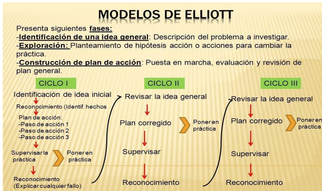
Ilustración 2. Esquema de la IAE de Elliot