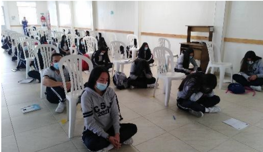
Ilustración 4. Fotografía del momento de silencio y meditación