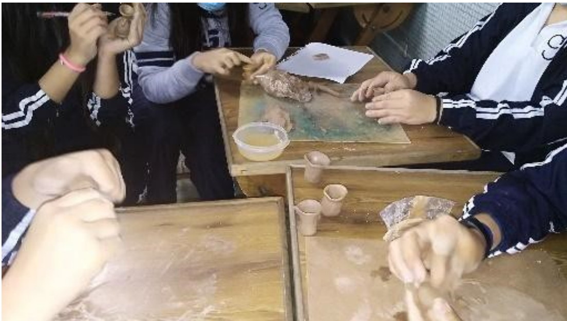
Ilustración 5. Fotografía de la actividad de arcilla