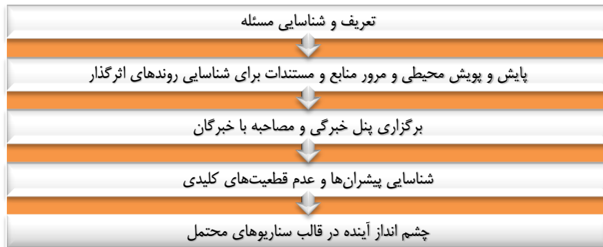
نمودار ۱. چارچوب و گام‌های پژوهش

پس از بررسی و تحلیل مجموعه‌ای از منابع و اسناد ذی‌ربط، تعداد قابل توجهی از روندها و عوامل اثرگذار بر وضعیت فعلی انرژی‌های تجدیدپذیر و آینده‌های محتمل آن شناسایی شد. سپس جهت استخراج مؤلفه‌های کلیدی و شناسایی پیشران‌ها ۱۵ نفر از خبرگان و کارشناسان دانشگاهی و حوزه سیاست‌گذاری برای پنل خبرگان گزینش شدند. این افراد از متخصصان حوزه انرژی، محیط‌زیست، روابط بین‌الملل و جغرافیای سیاسی بودند. پس از برگزاری چند دور از جلسات تخصصی با خبرگان، مؤلفه‌های کلیدی و پیشران‌ها نهایی شد. در گام بعدی میزان عدم قطعیت هر یک از پیشران‌ها براساس نظر همان کارشناسان از نمره ۱ تا ۱۰ ارزیابی شده است. در نهایت براساس خروجی به دست آمده از تحلیل رابطه میان مؤلفه‌های کلیدی از حیث تأثیرگذاری و تأثیرپذیری سناریوهای محتمل ترسیم گردید. مراحل انجام پژوهش در نمودار شماره ۱ ملاحظه می‌گردد.