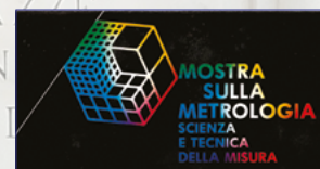
Mostra sulla Metrologia Scienza e tecnica della Misura