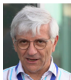
a cura di Alessandro Balsamo INRIM