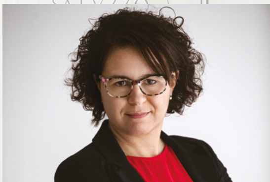
Le interviste del CMM CLUB Italia a Stefania Accorsi