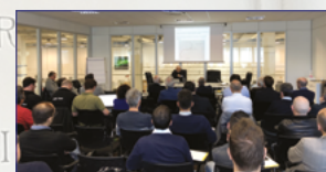
Un successo la 44° edizione di InTeRSeC