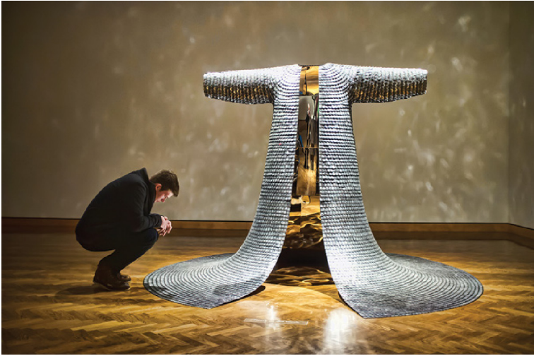
Figura 5. Do-Ho Suh, surcoreano, nacido en 1962. Some/One , 2005. Acero inoxidable, placas de identificación de soldados, resina de fibra de vidrio. 193.04 × 297.18 × 345.44 cm (aprox.). Minneapolis Institute of Art, The John R. Van Derlip Fund and gift of funds from the Sit Investment Associates Foundation 2012.77a-d. Arte © Do-Ho Suh

buscaba comandar la esfera pública de la visibilidad —lo que implicaba (como se muestra en el frontispicio) absorber a los espectadores en ella y también aislarlos— Do-Ho Suh y, aún más, Neto, invitan a los visitantes a ingresar literalmente en sus obras de arte, ya sea para atraparlos dentro y dirigir su visión hacia sí mismos (como hace el Leviatán) o para permitirles deambular en una aparente completa libertad. El anti-Leviatán de Neto, en particular, parece ofrecer esta libertad como un antídoto contra las trampas del Leviatán, su arbitrariedad como un antídoto contra la iconicidad del Leviatán, aunque la obra de arte gradualmente está entrando en una nueva iconicidad propia. Hobbes, por su parte, creía que los procesos de iconicidad eran fundamentales para la constitución del orden político (en cualquiera de sus formas), especialmente aquel que reificaba el concepto político más importante, el estado, en una forma de poder simbólico. Y es este símbolo el que encontramos aún alimentando la imaginación de Do-Ho Suh y Neto y siendo reconstruido, a través del recuerdo y la disección, en obras de arte que, a pesar de su resistencia a la imagen del poder de Hobbes, magnifican de manera similar el poder en una presencia que suscita el temor reverente [awe] de los visitantes.