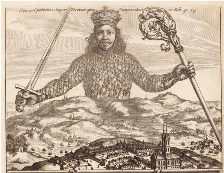
Figura 1. Abraham Bosse. Frontispicio del Leviatán (1651).

literalmente en un cuerpo político a medida que sus voluntades se unen contractualmente para autorizar al soberano a representarlos o —la etimología latina es crítica aquí— personificarlos . Los contornos de este cuerpo forman el molde en el cual se funde la “verdadera unidad de todos en una y la misma persona”, produciendo así al Leviatán, un “hombre artificial”, “de mayor estatura y fuerza que el natural”. 18