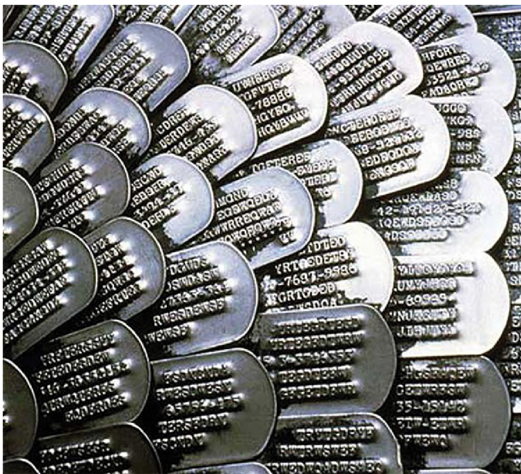
Figura 3. Do-Ho Suh, surcoreano, nacido en 1962. Some/One , 2005. Acero inoxidable, placas de identificación de soldados, resina de fibra de vidrio. 193.04 × 297.18 × 345.44 cm (aprox.). Detalle de las placas de identificación. Minneapolis Institute of Art, The John R. Van Derlip Fund and gift of funds from the Sit Investment Associates Foundation 2012.77a-d.

Arte © Do-Ho Suh