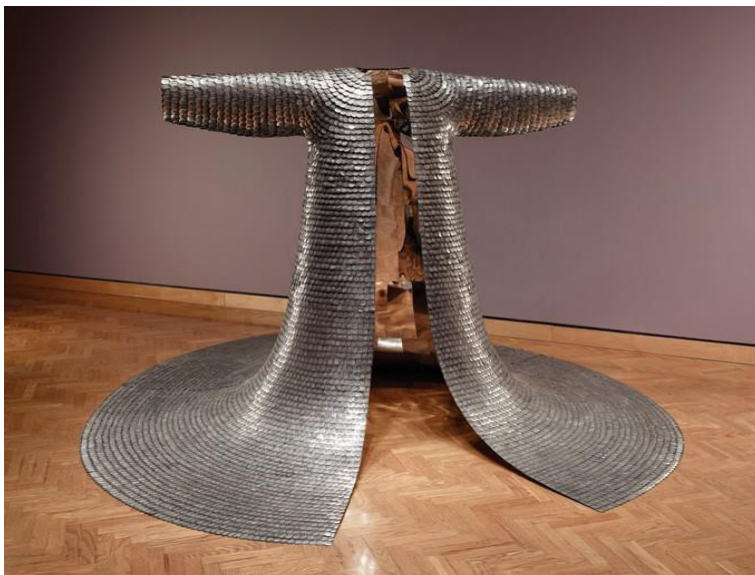
Figura 2. Do-Ho Suh, surcoreano, nacido en 1962. Some/One , 2005. Acero inoxidable, identificaciones militares, resina de fibra de vidrio. 193.04 × 297.18 × 345.44 cm (aprox.). Minneapolis Institute of Art, The John R. Van Derlip Fund and gift of funds from the Sit Investment Associates Foundation 2012.77a-d. Art © Do-Ho Suh.

buque de guerra cuya cubierta de placas blindadas se asemeja al exoesqueleto de una tortuga.