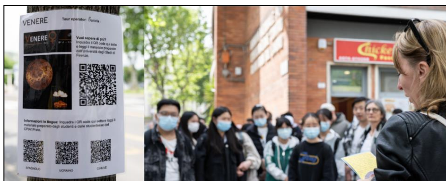
Figura 3. Passeggiata solare.

La valutazione formativa dell'intero processo si è basata sullo svolgimento di compiti di realtà, sulla gestione della giornata di fiera della scienza e sugli oggetti presentati (secondo la definizione triologica), prendendo in esame molteplici aspetti, quali le competenze di problem solving , organizzative e gestionali, la comunicazione in italiano e nella lingua madre, l'attitudine al lavoro di gruppo, l'impegno e la partecipazione.