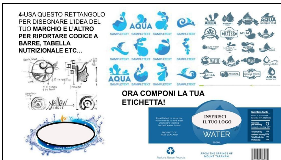
Figura 5. Schema 2 per la progettazione di un'etichetta creativa di una bottiglia d'acqua.

L'attività propedeutica al laboratorio, di fondamentale importanza, è stata l'analisi delle etichette delle acque in commercio, nonché lo studio delle differenze chimiche tra le acque in rubinetto e in bottiglia.