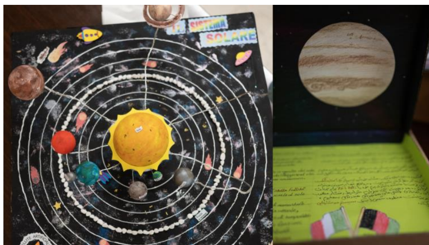
Figura 1. Modellini di sistema solare con materiale informativo multilingua.

I discenti, dunque, hanno assunto il ruolo di divulgatori per un giorno, hanno coinvolto i partecipanti illustrando ed esponendo i lavori, tra cui i modellini di sistema solare, i prodotti artistici corredati da un breve testo in più lingue ( Fig. 1 ); il memory e il gioco dell'oca tematico, presentati sia in formato digitale che da tavolo e tradotti dagli studenti nella propria lingua madre ( Fig. 2 ); il materiale informativo (cartellonistica) da utilizzare durante la Passeggiata solare ( Fig. 3 ).