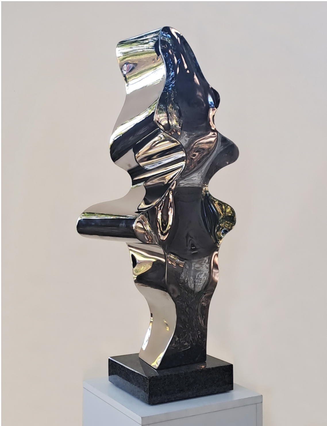
“Прегрни го сонот” “Embrace the Dream”