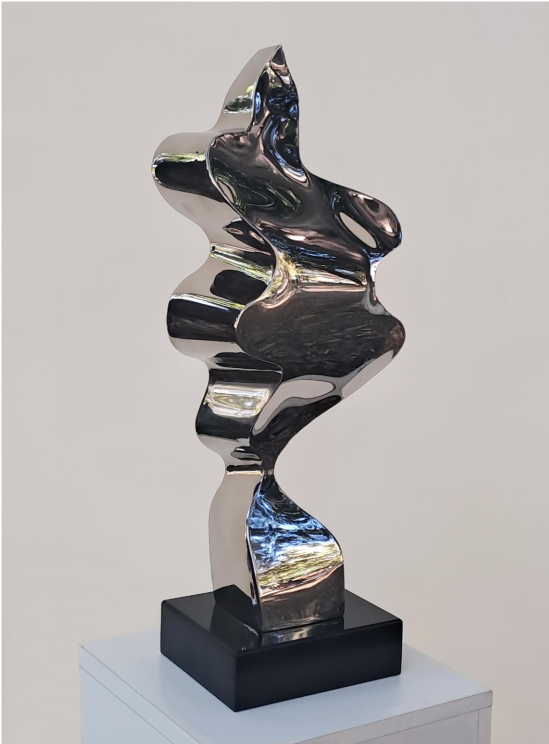
“Животна патека” “Life Path”