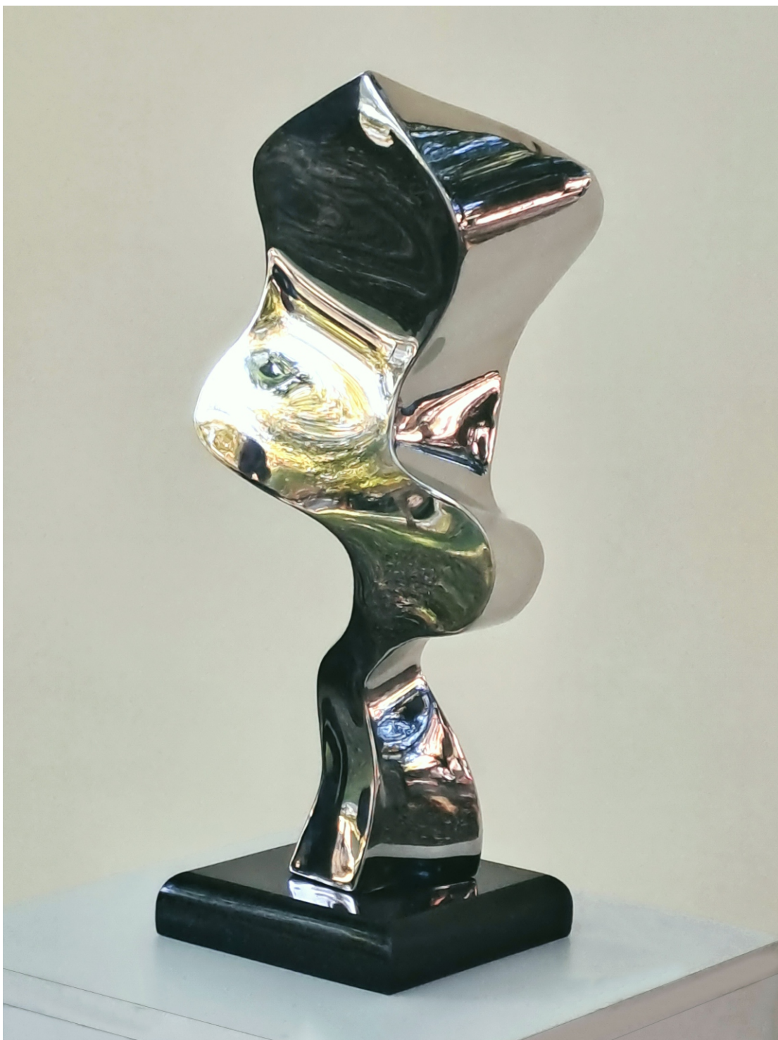
“Комплексен идентитет” “Complex Identity”