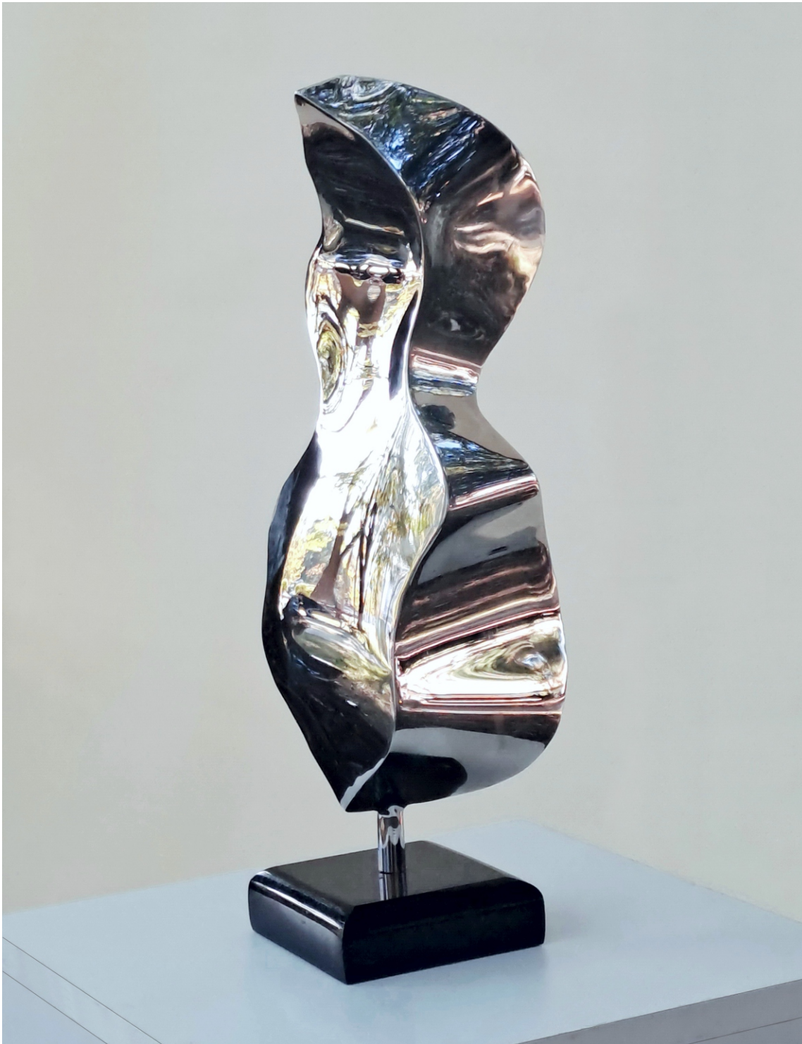
“Пркосен поглед” “Defiant Glance”