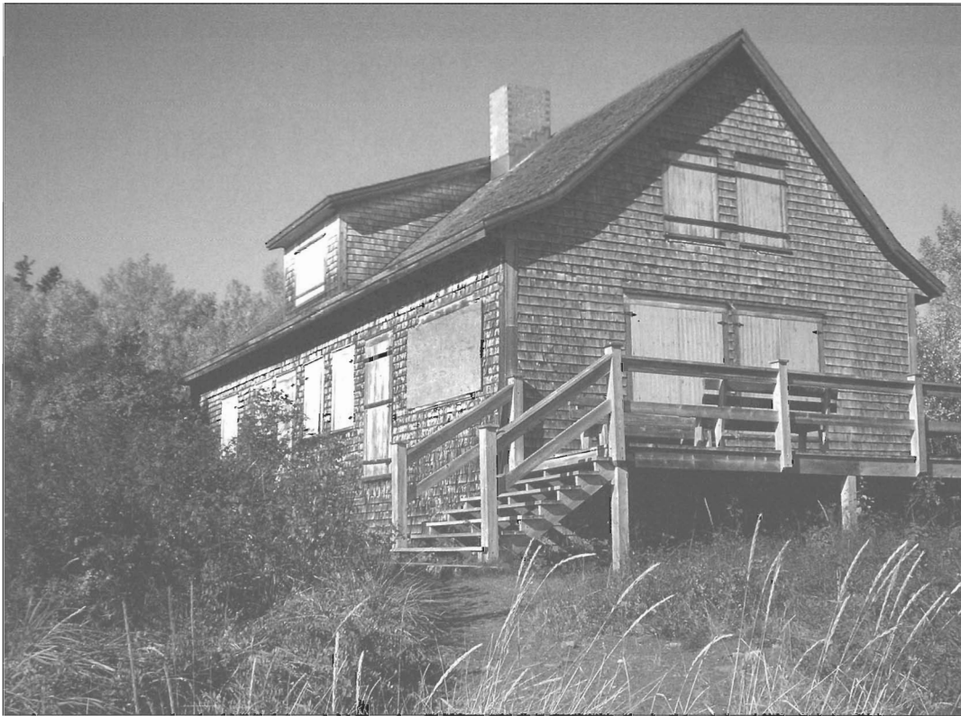
Chalet Feindel.

Parmi les quelques pionniers du Bic à la fin du 18 e siècle, on note la présence de pilotes établis soit dans la baie du Vieux-Bic, soit dans le secteur du Cap-à-l'Original ou encore à l'anse à Mercier de Saint-Fabien-sur-Mer. Outre le pilotage, qui implique de longues heures de veille dans le secteur nord-est de l'île du Bic (l'anse des Pilotes), ces navigateurs construisent une maisonnette sur la terre ferme, effectuent quelques