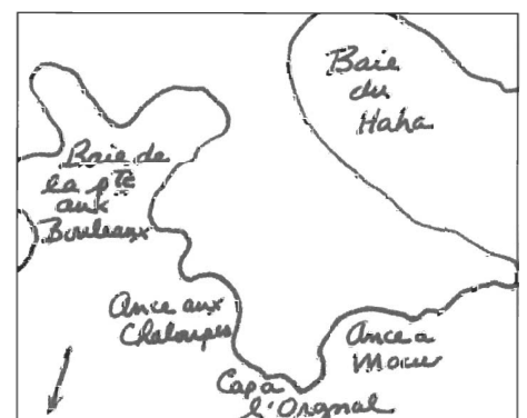
Carte d'une partie de la seigneurie du Bic esquissée d'après un plan de 1794. (Gaston Deschênes, Les exilés de l'anse à Mouille-Cul... , Sillery, Septentrion, 2006, p. 63)