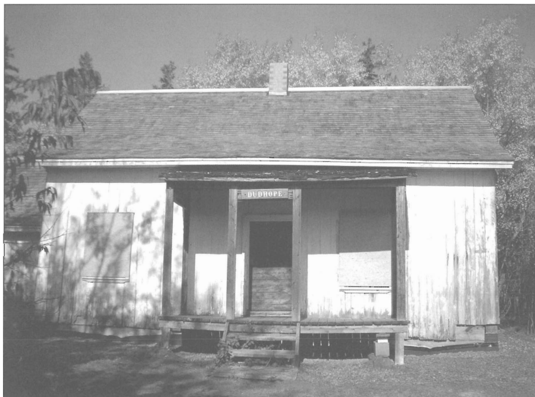
Chalet Wootton.

On doit au prêtre et historien régional Joseph Désiré Michaud deux ouvrages bien documentés et abondamment cités sur l'histoire de la région du Bic, rédigés au cours des années 1920. L'auteur y rappelle ce que la toponymie actuelle doit aux observations des plus anciens navigateurs, auxquels ce littoral pittoresque offrait une série de repères essentiels, à commencer par l'île du Bic et les havres naturels accessibles à marée haute. Il évoque également une série d'événements maritimes dans le voisinage immédiat du Bic: naufrages, pilotage, trafic maritime en temps de guerre, notamment en 1759 2 .