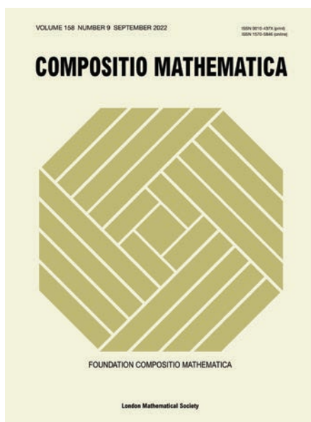
Het omslag van Compositio Mathematica