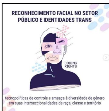
Imagen N° 2. Reconocimiento facial en el sector público e identidades