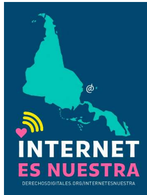
Imagen N° 1. Iniciativa Internet es nuestra