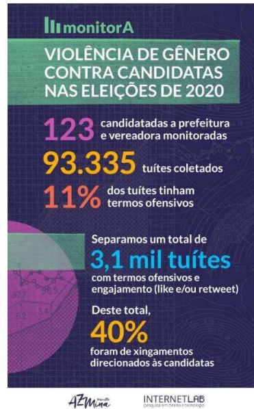
Imagen N° 5. Infografía sobre Violencia de género contra candidatas en las elecciones de Brasil del año 2020.