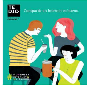
Imagen N° 3. Compartir Internet es bueno